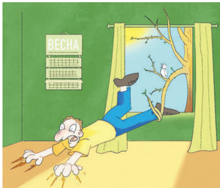
ИЛЛУСТРАЦИЯ НАСТАСЬИ НОВАТЭСКОЙ

Многих вгоняет в ступор то обстоятельство, что от них ничего не зависит. «Все меньше тех, кто строит дальние планы. А жить одним днем не у всех получается. И начинаются тревожные расстройства, депрессии и множество различных болезней».