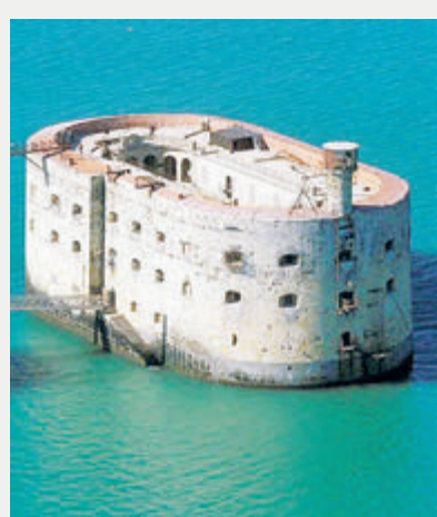
французской игры транслировалась у нас более 20 лет на нескольких ведущих каналах. Но после начала СВО съемки были прекращены, так что теперь нас это не насает.

Наверное, самая знаменитая крепость в мире – это форт Боярд. Миллионы зрителей в десятках стран знают его по одноименному телешоу. Но сегодня, по сообщению французских властей, форт находится в плачевном состоянии и нуждается в срочной реставрации.