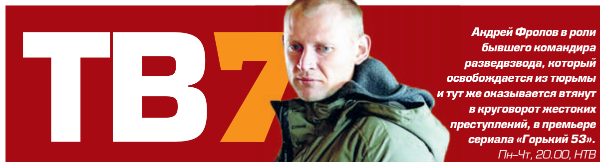
Андрей Фролов в роли бывшего командира разведывода, который освобождается из тюрьмы и тут же оказывается втянут в круговорот жестоких преступлений, в премьер-сериале «Горький 53». Пн-Чт, 20.00, НТВ