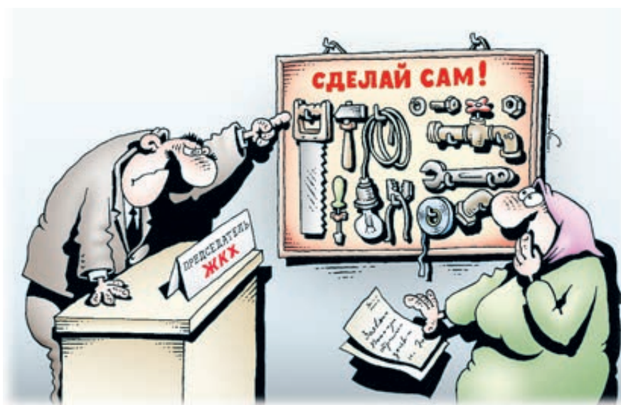
ИЛЛЮСТРАЦИЯ ИГОРА ЧЕРНОУСОВА/CARTOONBAN.RU

Тому виной – формула расчета стоимости коммунальных услуг, которая не зависит от формы управления многоквартирным домом. То есть у ресурсоснабжающей организации один тариф как для управляющей компании, так и для членов ТСЖ. Вдобавок после заключения прямых договоров