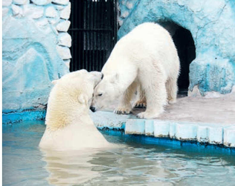
Феликс и Аврора – старожилы в парке «Роев ручей». Теперь у них появился вот такой сосед.

До прихода человека в Арктику белый медведь был ее единственным и полноправным хозяином. У этого красивого и сильного животного до сих пор нет врагов в естественной среде обитания. Однако активное хозяйственное освоение Арктики все чаще приводит к контактам между белым медведем и человеком. Животных жилищу геологов, охотников и нефтяников приводят голод и врожденная любознательность: белый медведь обладает поразительно чувствительным обонянием и способен уловить запах любой пищи на расстоянии нескольких километров.