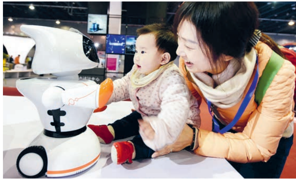
Роботы вошли в повседневную жизнь китайцев. Мать с сыном общаются с андроидом раннего обучения.

Китай открывает двери для инвестиций, развивает межгосудар-