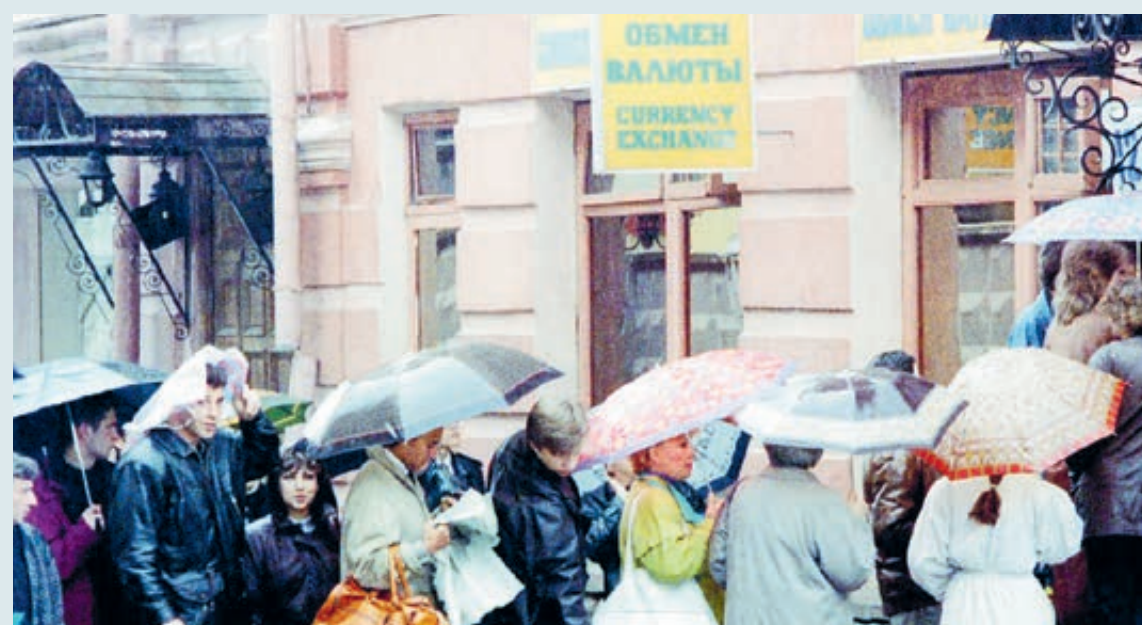
Октябрь 1994 года. «Черный вторник» в Москве.

8 (800) 700-03-49 КРУГЛОСУТОЧНО, звонки по РФ бесплатны www.vbrr.ru