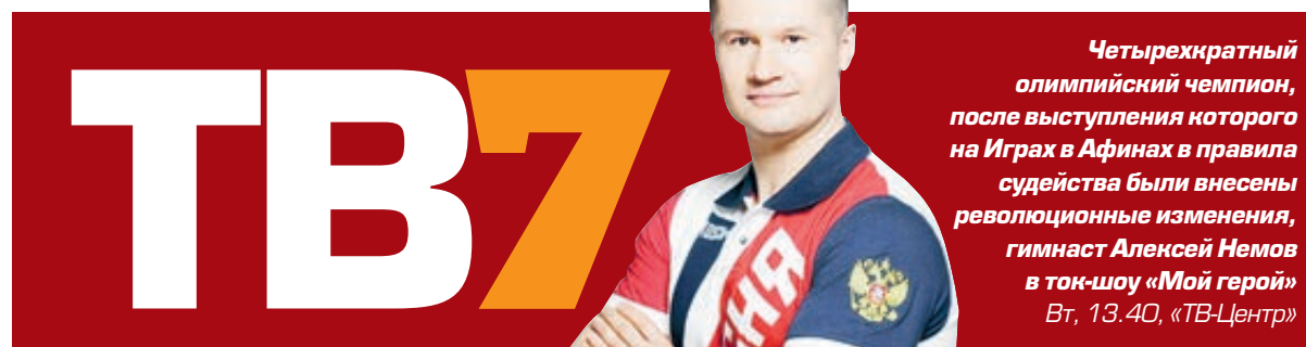
Четырехкратный олимпийский чемпион, после выступления которого на Играх в Афинах в правила судейства были внесены революционные изменения, гимнаст Алексей Немов в ток-шоу «Мой герой» Вт, 13.40, «ТВ-Центр»