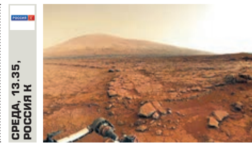
СРЕДА, 13.35, РОССИЯ К

Диана «Улика из прошлого» Официальная версия настаивает на несчастном случае. Однако масса улики говорит о том, что авария, унесшая жизнь принцессы Дианы, могла быть подстроена.