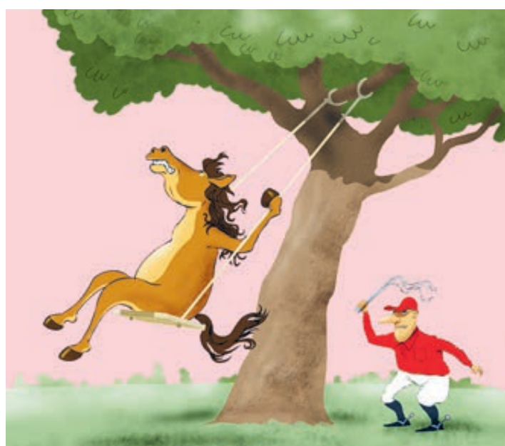
ИЛЛЮСТРАЦИЯ СЕРГЕЯ ЕЛКИНА/САЙТОВЫБРАНКИ.РУ

Однако почти половина россиян идею решительно отвергли, по-