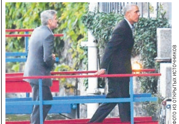
Итальянские папарацци сумели зафиксировать исторический момент. Возможно, с него начнется поход Клуни в президентское кресло.

Гостеприимные хозяева, Джордж с супругой Амаль, тоже суешили. Как разнохали репортеры, как назло, бассейн на вилле Оланда внезапно остыл и наполнился опорожнился. Итальянская охрана вызвала местного сантехника, которому сам Клуни растолковывал на своем итальянском, что проблема, мол, в том, что приезжает его «очень загорелый друг, который не переносит холодной воды». Перепуганный сантехник исправил датчик, и бассейн наполнился и нагрелся. Клуни успокоился и снял с сантехником selfie.