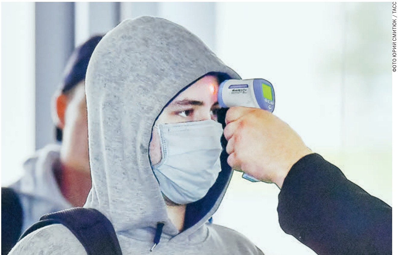
Мы снова на прицеле у Ковида.