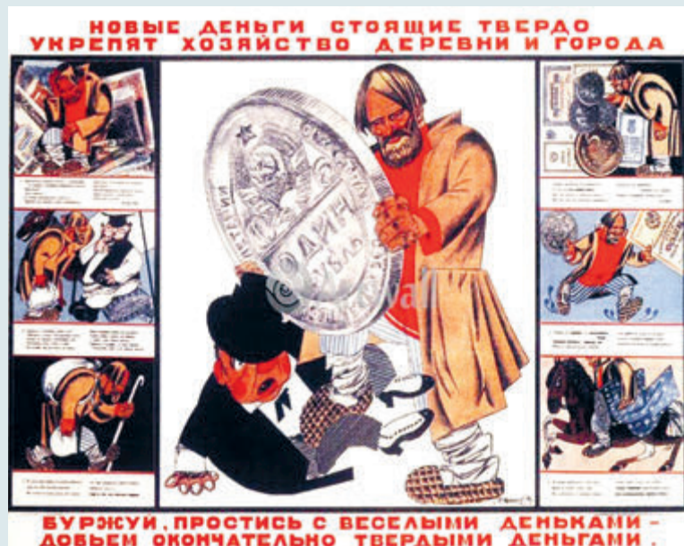
БУРЖУИ, ПРОСТИТЬСЯ С ВЕСЕЛЫМИ ДЕНЬГАМИ – ДОВЬЕШЬ ОКОНЧАТЕЛЬНО ТВЕРДЫМИ ДЕНЬГАМИ.