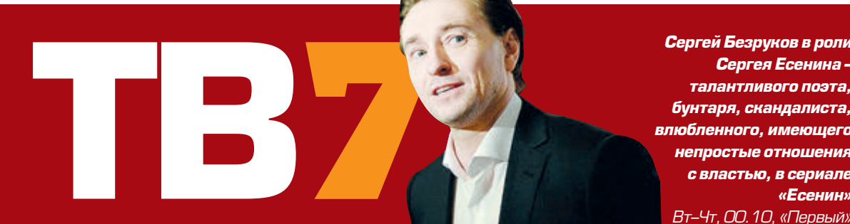
Сергей Безруков в роли Сергея Есенина – талантливого поэта, бунтаря, скандалиста, влюбленного, имеющего непростые отношения с властью, в сериале «Есенин» ВТ-Чт, 00.10, «Первый»