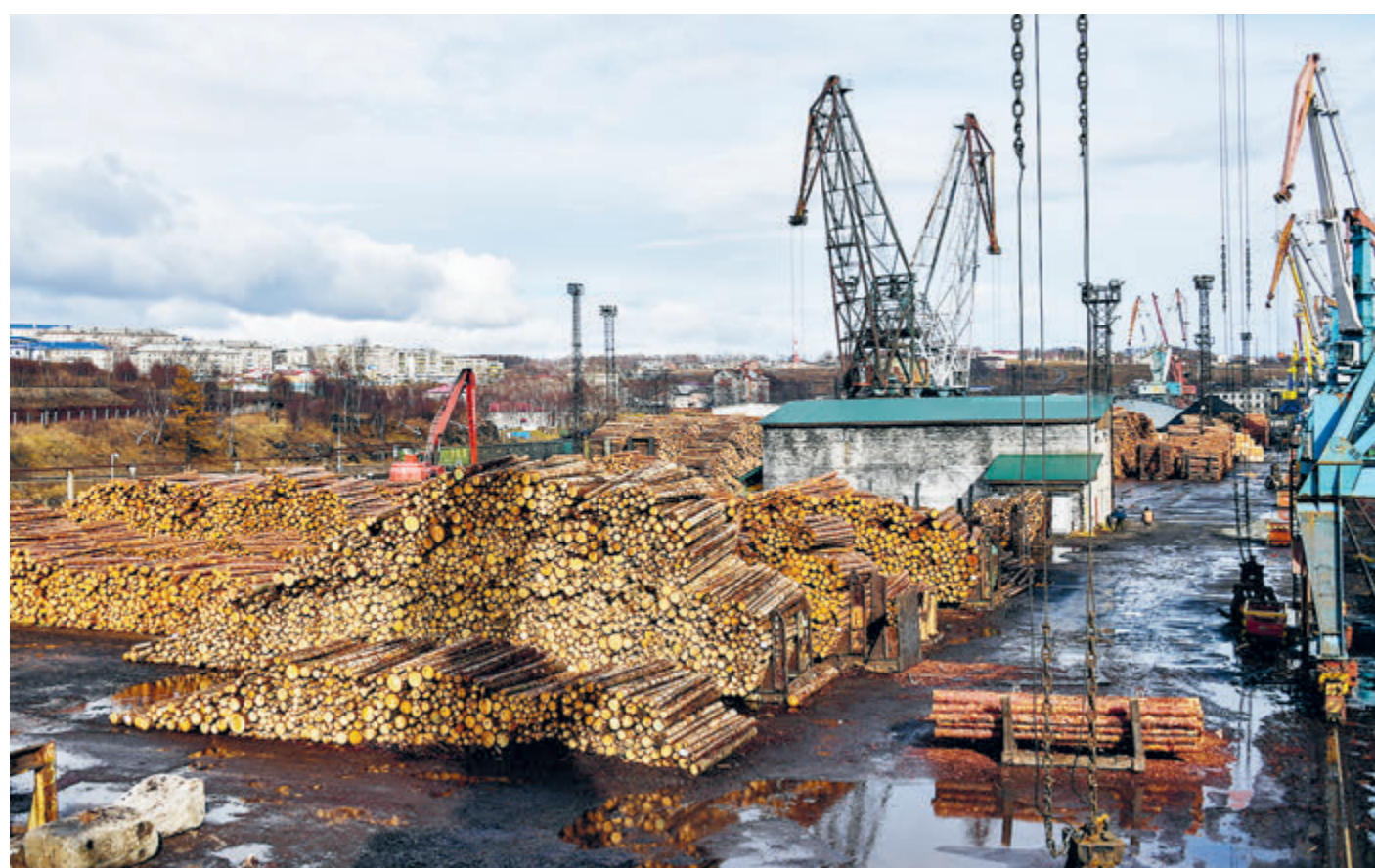
Знаменитый Ванинский порт. Все, как и десятилетия назад.

По мнению президента, главная беда лесного комплекса – «жульничество процветало так, как никогда, расхищение просто зашкаливало, процветали хищнические, нелегальные вырубки». А потому «действовать надо широко... жестко заниматься декриминализацией отрасли: то, что там происходит, вообще ни в какие ворота не лезет...». И прежде всего, призывает Владимир Путин, надо «поставить