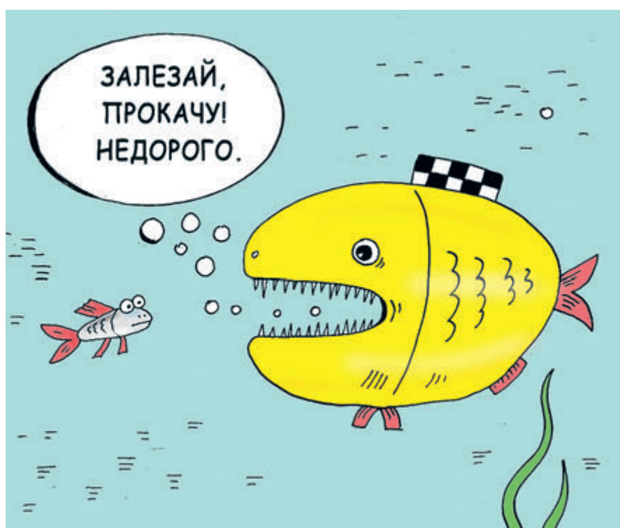
ИЛЛЮСТРАЦИЯ ВАЛЕРИЯ ТАРАСЕНКО/САНТООБРАНИИ.РУ

По данным экспертов, в каждой четвертой аварии в столичном регионе принимают участие автомобили такси. И далеко не всегда последствия для пассажиров ограничиваются легким испугом. Если люди в салоне получили травмы и нуждаются в лечении, то в качестве компенсации затрат они могут рассчитывать только на полис ОСАГО. А там максимальная выплата ограничена суммой