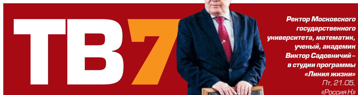
Ректор Московского государственного университета, математик, ученый, академик Виктор Саввинич – в студии программы «Линия жизни» Пт, 21.05, «Россия Н»