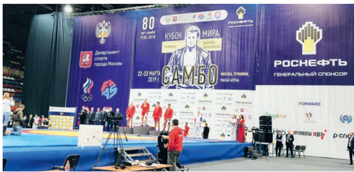
Российские спортсмены вышли победителями в борьбе, которая родилась в России.