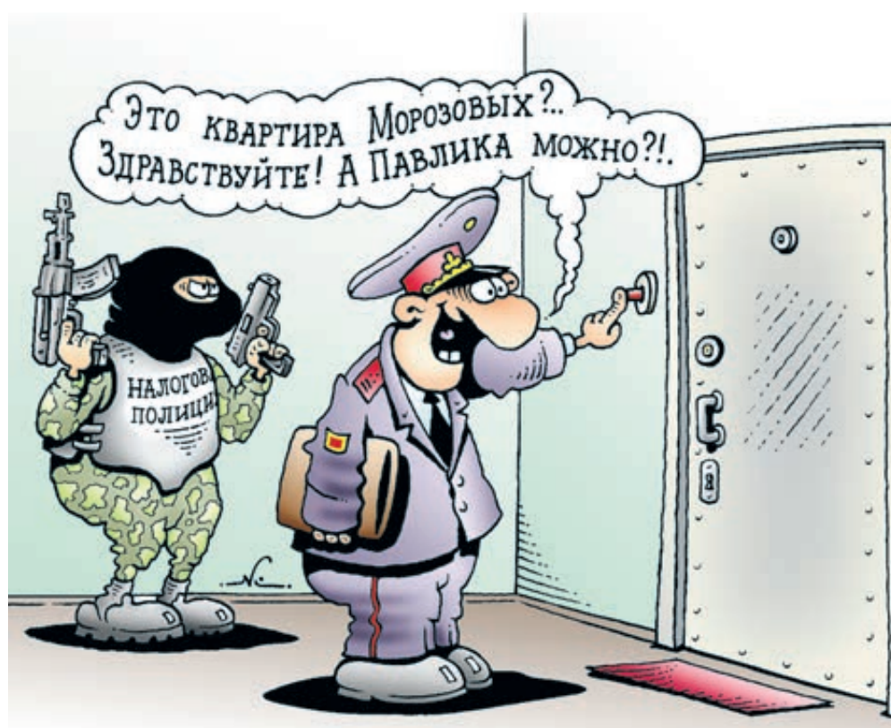
Иллюстрация Игоря Кийко/ARTGOOBYANK.RU