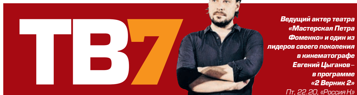
Ведущий актер театра «Мастерская Петра Фоменко» и один из лидеров своего поколения в кинематографе Евгений Цыганов – в программе «2 Верник 2» Пт, 22.20, «Россия Н»