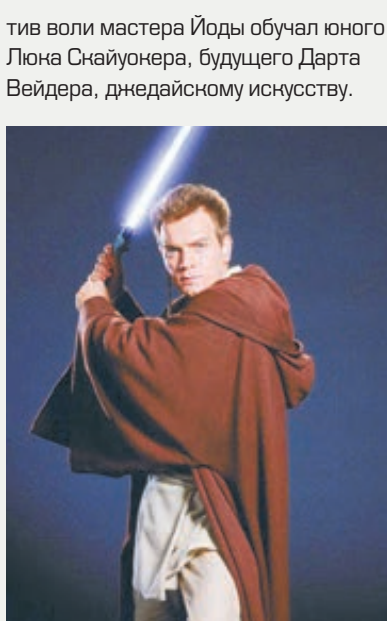
Оби-Ван Кеноби из «Звездных войн»