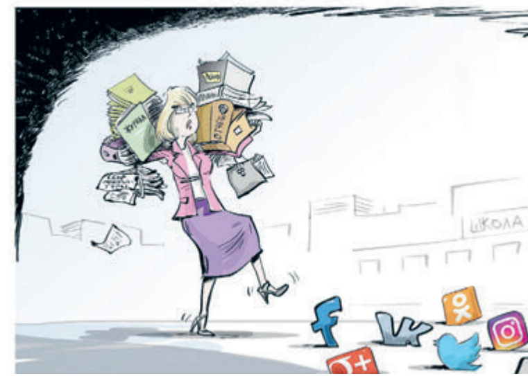
ИЛЛЮСТРАЦИЯ СЕРГЕЯ ЦИГАНА

О тех, кто еще не совсем Мафусаил. Минимальный оклад доцента на полную ставку – 72 тысячи. Живи и радуйся – ведь это за 36 часов в неделю, можно и потерпеть. Однако эта самая полная ставка редко кому выпадает, легче выиграть в лотерею. Платят в пределах выделенных фондов, а преподавать надо всю учебную программу целиком. Если кто-то не хочет работать частично задарма, всегда найдутся другие желающие. Не всех ведь возьмут в дворники, курьеры и продавцы, а некоторые и сами туда почему-то не стремятся, норовят правдами и неправдами остаться преподавать тот предмет, которому они посвяти-