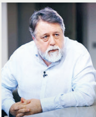
Знаменитого режиссера-документалиста, лауреата многочисленных призов, президента фестиваля «Арт-донфест» Виталия Манского МВД объявило в федеральный розыск.

Знаменитого режиссера-документалиста, лауреата многочисленных призов, президента фестиваля «Арт-донфест» Виталия Манского МВД объявило в федеральный розыск. Он не раз попадал в поле зрения правоохранительных органов, в частности, за одиночный пикет с трусами в руках в поддержку Навального. Но не это переполнило чашу терпения правоохранительных органов, и дане не осуждение кинематографистом СВО. Манский оказался в ведомственной базе розыска по уголовно-делу. Дело расследуется по ч. 2 ст. 128.1 УК РФ (клевета, содержащаяся в публичном выступлении). И теперь ему грозит штраф до 1 млн рублей или лишение свободы сроком до двух лет. А все дело в том, что в интервью на YouTube-канале «Осторожно: Собчак» журналист заявил, что в процессе подготовки Московского международного кинофестиваля происходит хищение зна-