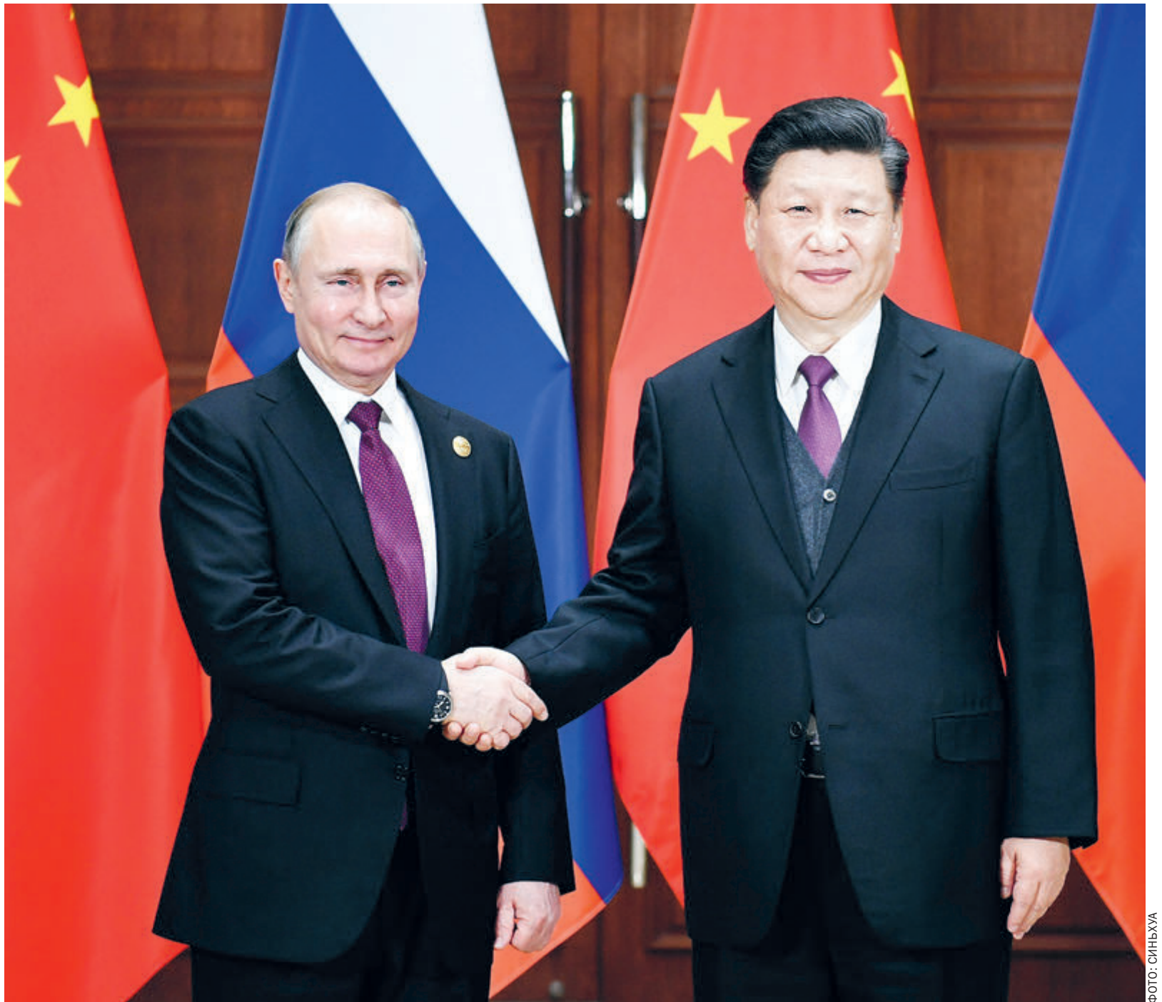
Председатель КНР Си Цзиньпин и президент РФ Владимир Путин.

В-третьих, глубоко и значительно укрепилась экономическая безопасность.