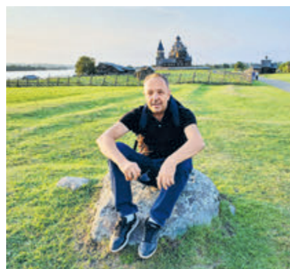
Автор этого репортажа Василий Щуров уверен: настоящие чудеса – совсем рядом, только руку протяни.