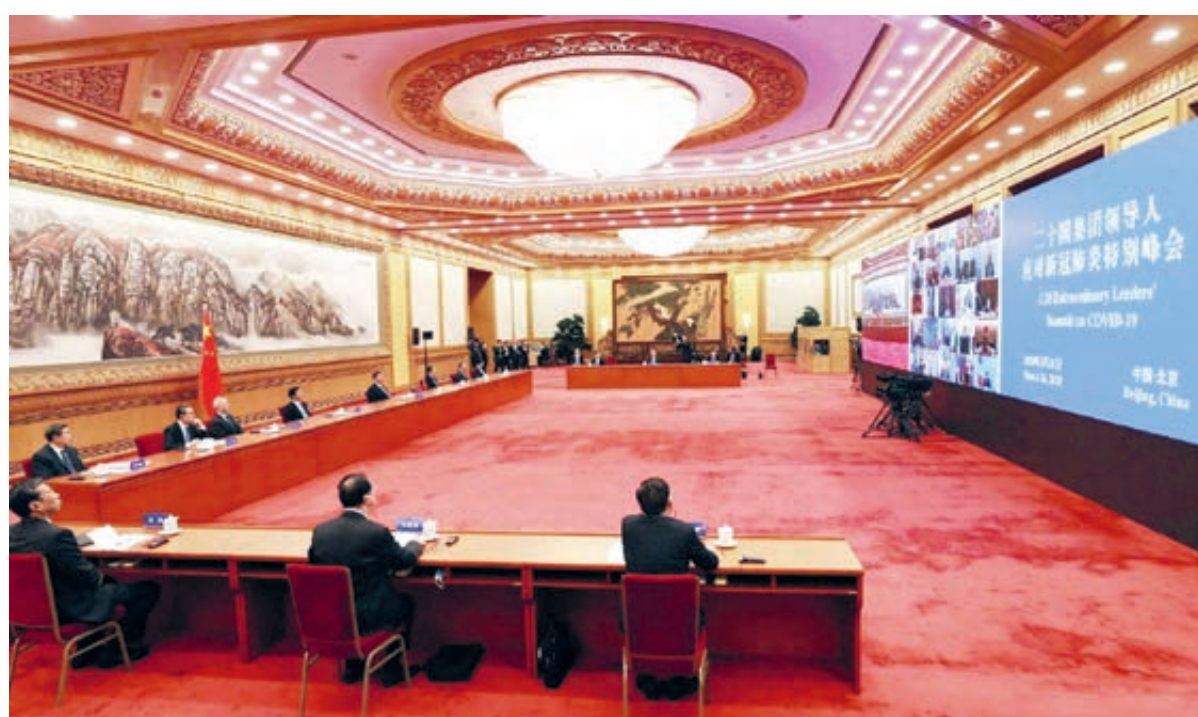
Руководство КНР во главе с Си Цзиньпином во время проведения саммита G20 в видеоформате.

Предлагаю как можно скорее провести совещание министров здравоохранения стран G20, чтобы улучшить обмен информацией, укрепить сотрудничество в области разработки препаратов, вакцин и противоэпидемического контроля, а также пресечь трансграничное распространение инфекции