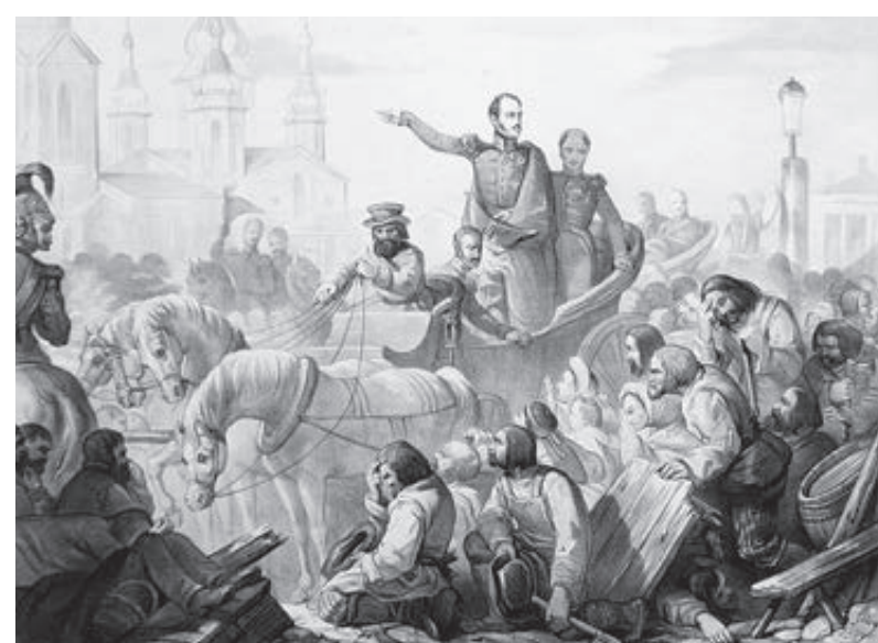
Николай I усмиряет холерный бунт.

На пьедестале памятника Николаю I на Исакиевской площади в Петербурге горельефы изображают важнейшие события правления императора, в том числе усмирение холерного бунта на Сенной площади в 1831 году. Государь изображен стоящим в колыхающей в полный рост, он указывает на церковь, а народ перед ним пал на колени и крестится.