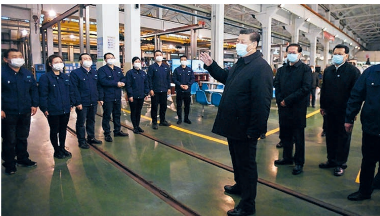
29 марта Си Цзиньпин приехал в провинцию Чжэцзян, чтобы на месте ознакомиться с тем, как происходит возобновление производства на предприятиях.

Во-вторых, нам следует действовать сообща и вывести вопросы контроля и лечения на международный уровень. Вирус не признает государственных границ. Вспышка инфекции, с которой мы боремся, – это наш общий враг. Все мы должны вместе работать над созданием самой прочной, какую только видел мир, глобальной сети контроля и лечения. Китай основал онлайн-базу знаний по COVID-19, доступную для всех стран. Важно, чтобы все страны объединили свои силы и ускорили разработку и внедрение лекарств, вакцин и тестовых систем в надежде в ближайшее время добиться результатов, которые принесут пользу всем нам. Нужны дискуссии, касающиеся формирования региональных экстренных механизмов связи,