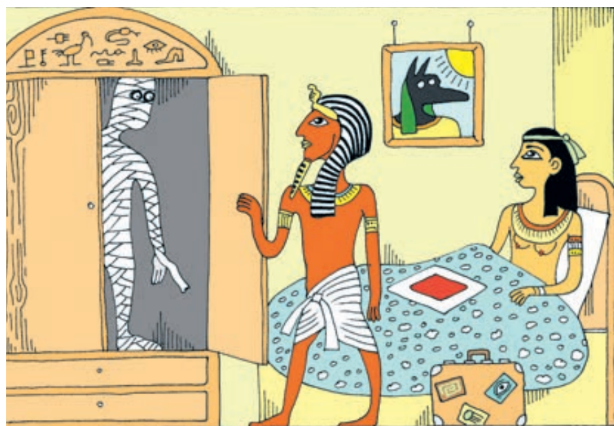
ИЛЛЮСТРАЦИЯ: ВАЛЕРИЯ ТАРАСЕНКО / CARTOONBANK.RU

Оскорбил известный телекомментатор не менее известного футбольного вратаря – суд назначил компенсацию за страдания в размере 75 тысяч рублей. Заподозрили журналисты популярную певицу в вампиризме – суд постановил выплатить в ее пользу за оскорбление 100 тысяч. При этом моральный вред болному за травму легкого, поврежденного из-за ошибочных действий хирурга, оценили в 7 тысяч, а не-