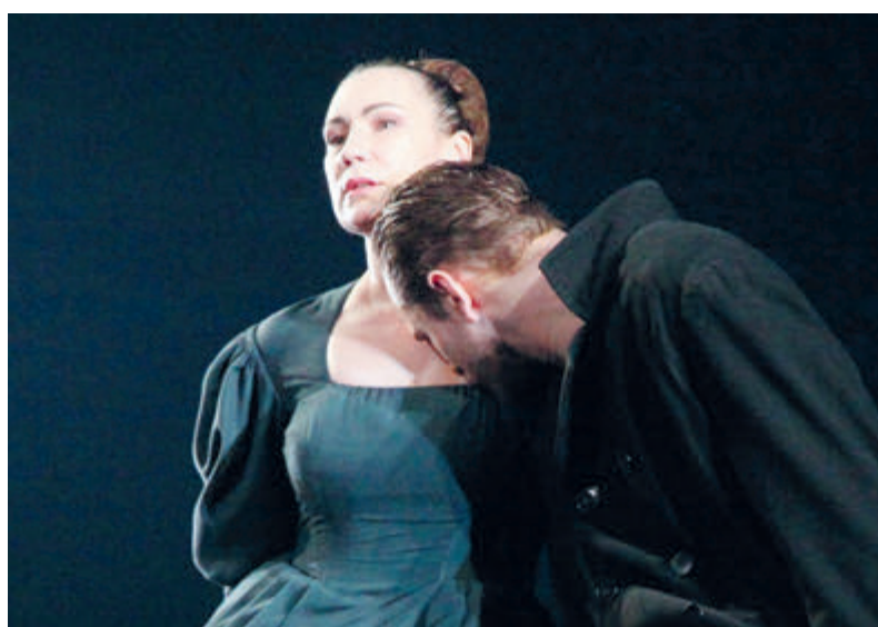
На съемках «Отражения звезды», в вахтанговском спектакле «Гроза» и в домашнем «женском царстве».