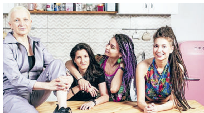
Та самая реклама, которая сильно возбудила некоторых ведущих отечественных телеканалов.

Новот в актуальной повестке повезло свежей струей. На вручении премии «Муз-ТВ» настолько навязчивой оказалась «голубая» тематика, что даже Роскомнадзор решил проверить мероприятие на предмет гей-пропаганды. Потом в эфире «Москвы 24» худрук Театра на Малой Бронной Константин Богомолов, делясь планами будущего сезона, сообщил, что на роль Раневской в «Вишневом саде» намерен пригласить трансгендера Наталью Максимо-ву. Раньше та была мужиком. Каминг-аут, кстати, совершила в шоу Ксении Собчак, жены Богомолова. Образ врага саббревиатурой ЛГБТ, буквально вчера притворявшегося спящим, начал принимать угрожающие формы. Но не хватало чего-то еще, какой-то мелочи, чтобы уж точно соответствовать правилу: один раз – случайность, два – совпадение, три – закономерность. И оно не заставило себя ждать.