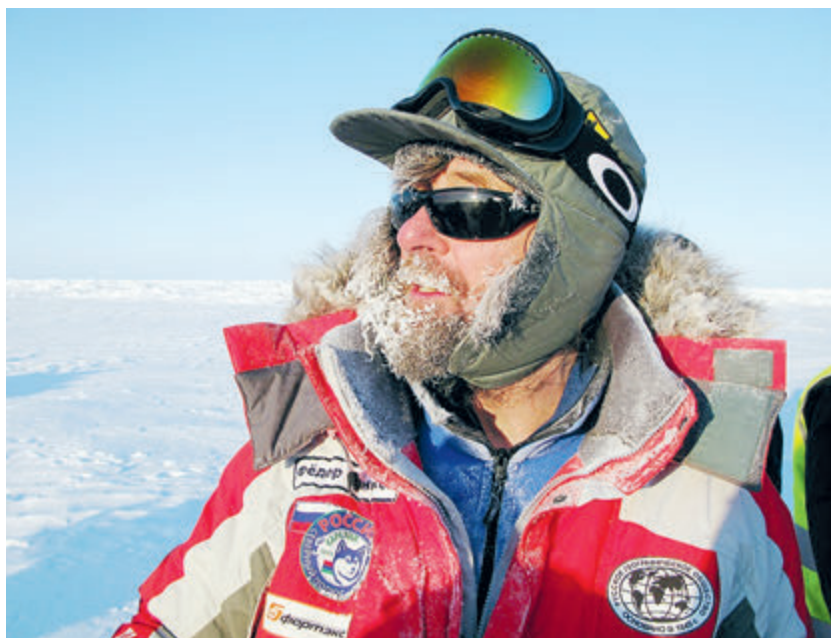
ФОТО: ИЗ ОПЫТА ИСТОЧНИКОВ

Потом, уже осенью, я пойду в кругосветное плавание на катамаране. И все с той же целью: буду изучать источники загрязнения океанских вод промышленными отходами. К этой теме мы вернемся и на следующий год, когда на том же катамаране пойду от Мурманска до Владивостока через Чукотку. И в устье каждой реки с помощью точных приборов буду изучать количество промышленных и бытовых отходов и их состав. Потом собираюсь провести аналогичные