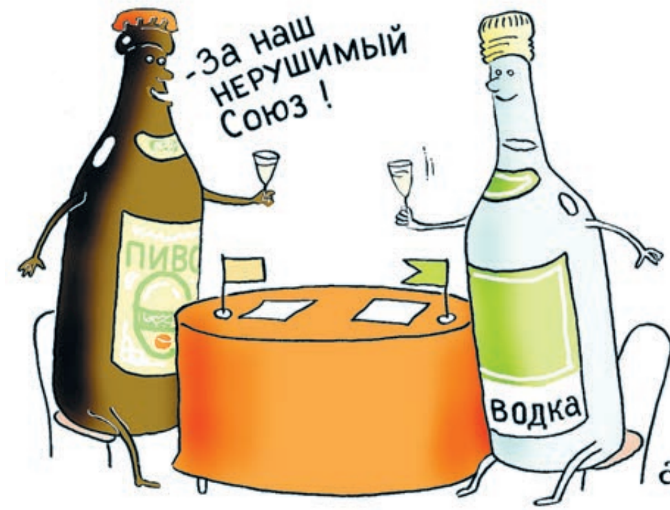
ИЛЛЮСТРАЦИЯ ВАСИЛИЯ АЛЕКСАНДРОВА / SAFTOOBANK.RU

То есть, говоря без обиняков, требуется фактически единое экономическое пространство. Как это произошло с Крымом.