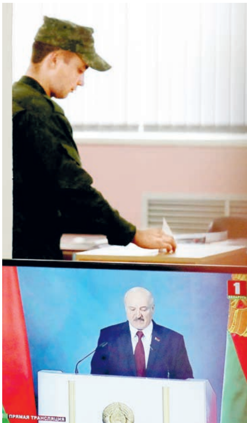
В Белоруссии уже идет голосование. О результатах узнаем в воскресенье?

Но официальная статистика свидетельствует: производительность труда в Белоруссии более чем в 6 раз ниже, чем в странах ЕС, и почти вдвое ниже показателя государств Центральной и Восточной Европы. Доля высокотехнологичной продукции в экспорте не превышает 3%. Почему так? Плохо работают или плохо управляют? Но где гарантия, что после вхождения республики в РФ у белорусов все будет иначе? Ведь с производительностью труда у России тоже неважно: от Европы отстаем в 3–4 раза, от США – в 4–5 раз. И доля высокотехнологичного экспорта у России мизерна: в 2016-м зафиксировано 2,35%, с тех пор почти не прибавилось. А если сравнить с мировым уровнем, получим «слезы»: нынешние российские поставки – лишь 0,3% от мирового объема высокотехнологичного экспор-