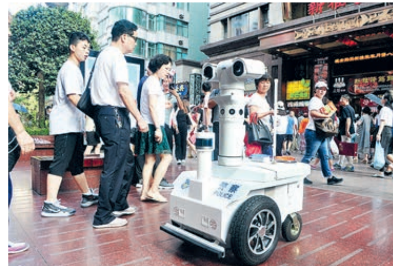
На пешеходной улице Нанцзинлу в Шанхае появился патрульный полицейский робот по имени Вали. Он обладает функцией распознавания лиц.

Китай уверен, что обладает всем необходимым для экономического восстановления, для всестороннего строительства среднестатистического общества и окончательной победы над бедностью.