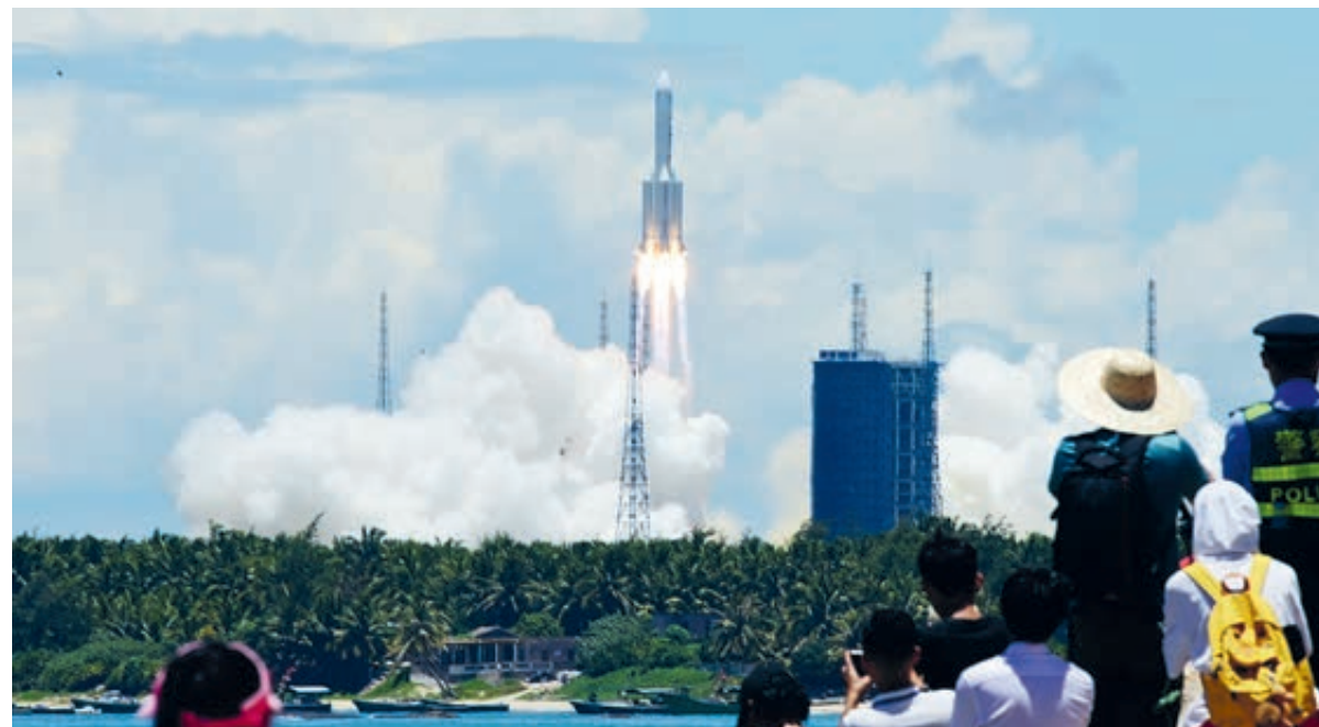
23 июля 2020 года Китай с помощью ракеты-носителя «Чанчжэн-5» запустил свой первый зонд для изучения Марса «Тяньвэнь-1». Старт был осуществлен с космодрома «Вэньчан» в провинции Хайнань.

Во втором квартале 2020 года ВВП КНР вырос на 3,2%