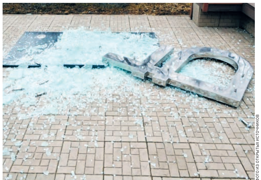
Что останется от рубля к осени? На этот счет хватает апокалиптических прогнозов.

Казна и впрямь изрядно похудела на коронавирусных затратах, и впереди полная неясность. Виталий Манкевич, президент Русско-Азиатского союза промышленников и предпринимателей, считает, что нынешнее падение рублевого курса – это управляемая девальвация как мера поддержки экспортеров и бюджета. Ему возражает первый зампред комитета СФ по экономической политике Сергей Калашников: «Мы сделали рубль свободно конвертируемым внутри страны. Но мир не признал рубль твердой валютой и даже полутвердой, как китайский юань, курс которого определяется директивно. Это значит, если вы с рублями поедете за гра-