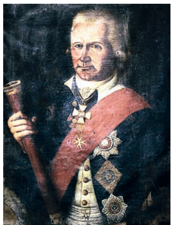
Единственное прижизненное изображение адмирала Ушакова.

Меры оказались действенными, тогда как в городе, да и в других командах количество смертей нарастало. Пока, наконец, 16 сентября, после того как отпраздновали спуск на воду первого линейного корабля «Слава Екатерины», князь Потемкин, возглавлявший сухопутные войска и флот юга России, не приказал приостановить работы на верфях. Горожан заперли по домам на карантин, а команды кораблей увели подальше от города, в степь. Капитан Ушаков и тут устроил все по-своему. Матросов и