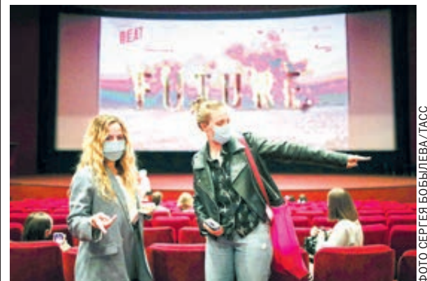
В Москве в среднем приходят сегодня четыре зрителя на сеанс.

Скромные кассовые сборы первого уик-энда — результат не только опасливости зрителей, которые боятся заразиться во время похода в кино, хотя на самом деле шанс подхватить вирус в кинотеатре неизмеримо меньше, чем, скажем, в магазине или метро. Дело еще и в хиллом кинорепертуаре. Фильмов-событий, способных заманить толпы в зал, в афише нет. В ней преобладают либо старые картины, чьи премьеры состоялись еще до пандемии, либо откровенные аутсайдеры проката, такие, например, как не самая удачная «Фея» Анны Меликян, которая уже была показана на онлайн-платформах и не снискала там успеха.