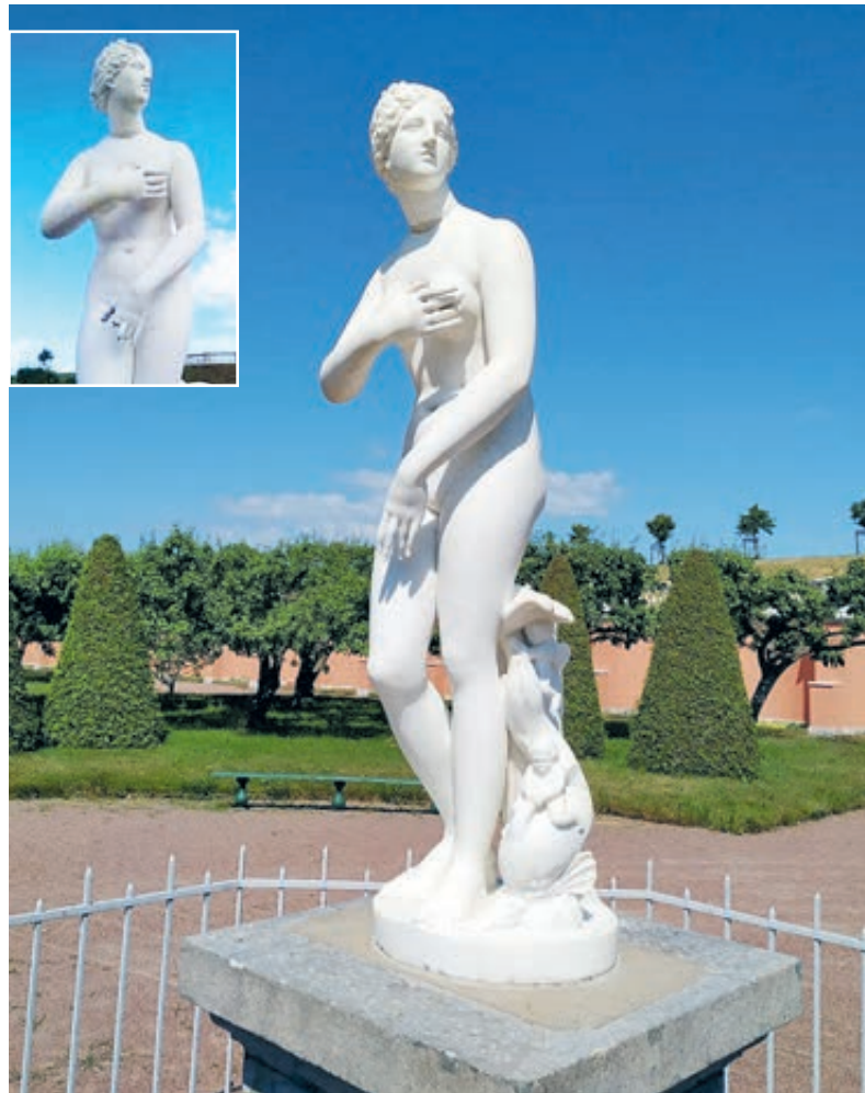
Мраморной Венере Медицейской сломали четыре пальца.

«Надеюсь, семья получила извинения за то, что почти сутки несовершеннолетний был оскорблен в публичном пространстве словом «вандал»?.. Вы должны обеспечивать детям безопасную среду. На уровне их роста писать, что можно трогать, а что нельзя. И снабдить соответствующей картинкой.