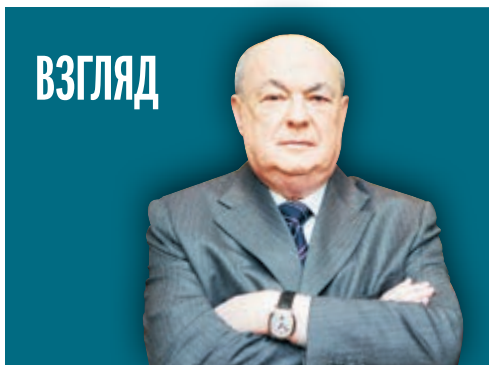
ВЛАДИМИР РЕСИН ДЕПУТАТ ГОСУДАРСТВЕННОЙ ДУМЫ, ПРЕДСЕДАТЕЛЬ ЭКСПЕРТНОГО СОВЕТА ПО СТРОИТЕЛЬСТВУ

В настоящее время эпидемия все еще распространяется по миру и оказывает влияние на мировую экономику. Экономическое развитие Китая по-прежнему сталкивается со множеством вызовов и проблем, но мы абсолютно уверены в будущем экономики Китая. Китай готов работать со всеми для координации макроэкономической политики, укреплять сотрудничество в профилактике и контроле эпидемии, восстановлении производства и других областях, сплоченно создавать мировую экономическую открытого типа, а также прилагать неустанные усилия для стабильного восстановления и скорейшего вывода мировой экономики из рецессии.