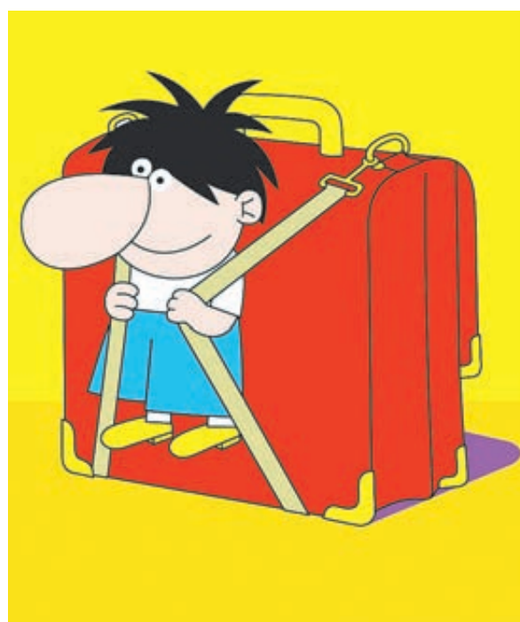
ИЛЛЮСТРАЦИЯ: ВАЛЕРИЯ ХОМЯКОВА / CARTOONBANK.RU

Но, несмотря на столь масштабную подготовку, дружное и повсеместное начало учебного года 1 сентября не