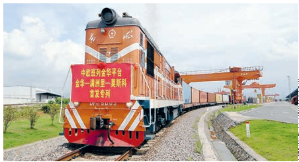
Товарный состав начал свой путь до Москвы из города Цзиньхуа провинции Чжэцзян.