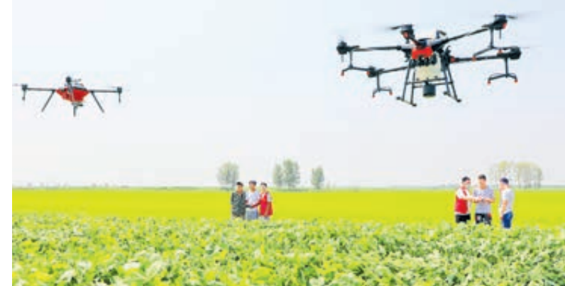
Обучение фермеров навыкам эксплуатации сельскохозяйственных дронов. Эти устройства ведут мониторинг, вводят удобрения, борются с вредителями.