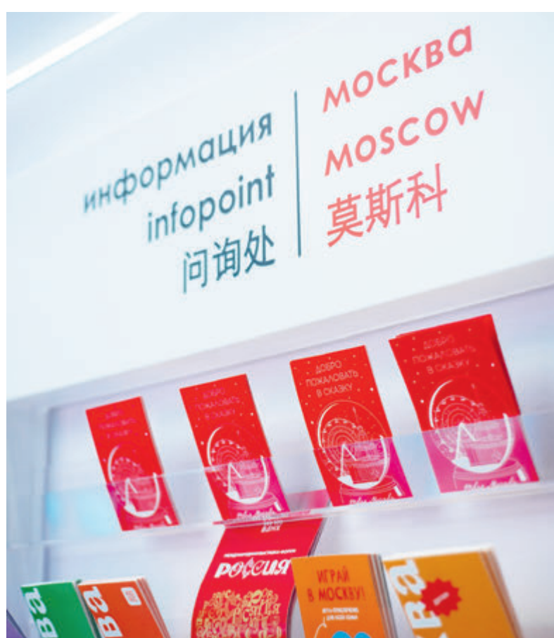
Именно Москва летом на полях ПМЭФ-2023 первой заключила с «Роснефтью» соглашение о взаимодействии в сфере туризма.

«Для создания комфортных условий автолюбителям, предпочитающим путешествовать на машине, «Роснефть» запустила специальную информационно-сервисную платформу. Проект позволяет автотуристам выбрать и спланировать маршрут по интересным местам через инфраструктуру придорожных сервисов и АЗС «Роснефти». У проекта «Горизонты России» есть ряд ключевых отличий от аналогов. Благодаря уникальному навигационному функционалу, все интересные локации становятся остановками маршрута, который автотурист может самостоятель-