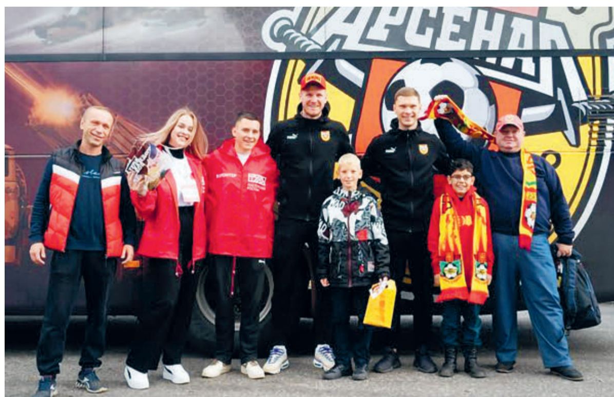
На полях выставки «Россия» объявлено о старте нового проекта «Путешествуй в Тулу с «Роснефтью».

Туристам предлагается посетить Тульский кремль, обновленную Казанскую набережную, Музейный квартал и Ясную Поляну, а также увидеть инопланетные пейзажи Кондуков, живописный Богородицк и легендарное Куликово поле