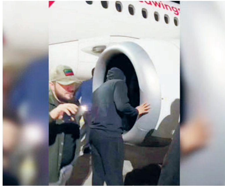
ФОТО: ИСТОРИЧЕСКИЕ ИЗОБРАЖЕНИЯ

Наверное, именно эта песня закрутилась в головах телевизионных экспертов, когда начались известные события на Ближнем Востоке и следовало дать их оценку перед взъискательной аудиторией.