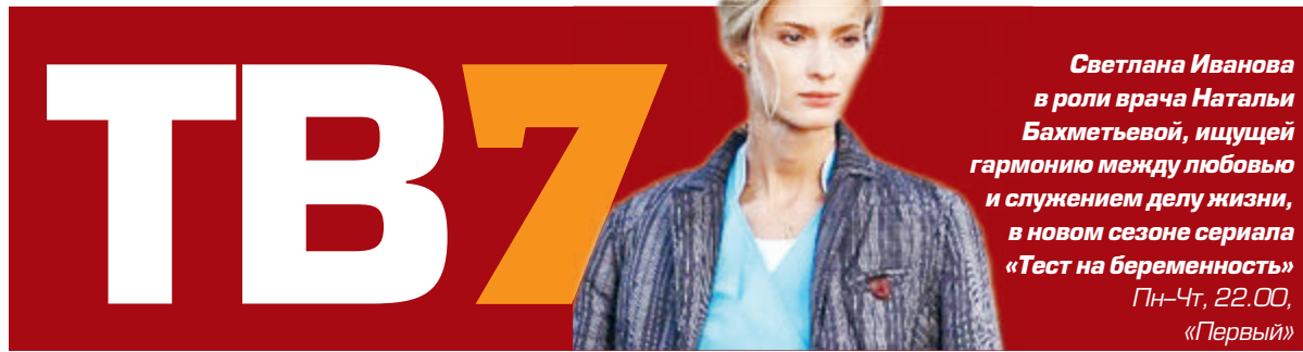
Светлана Иванова в роли врача Натальи Бахметьевой, ищущей гармонию между любовью и служением делу жизни, в новом сезоне сериала «Тест на беременность» Пн-Чт, 22.00, «Первый»