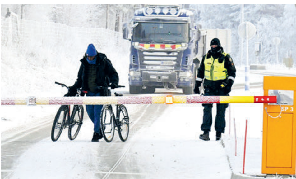
Финский пограничник и беженец на пограничном переходе в Салле на севере страны.

мукше на границе с Финляндией пункт обогрева для скопившихся мигрантов прекратил свою работу, поскольку их всех вывезли из города.