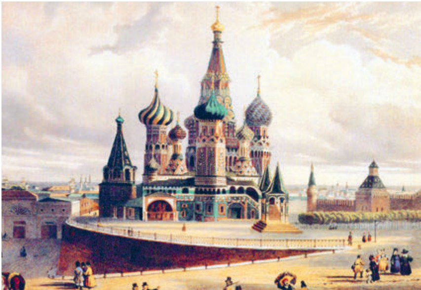
Этот храм на Красной площади издавна москвичи зовут собором Василия Блаженного.

Впрочем, не столь склонные к мистицизму люди (в те времена их, правда, было немного) утверждали, что никакой это не провидческий дар, а просто острый ум и способность сопоставлять факты: дескать, зная о стройке, легко предположить, что она занимает мысли государя. Действительно, Христа ради юродивые (так принято было называть тех, кто осознан-