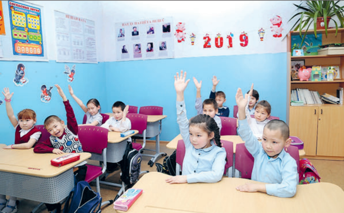
Урок национального языка в школе Харампура.

Благодаря модернизации оборудования на терминале НК «Роснефть» в Архангельске отгрузка нефтепродуктов для северного завоза достигнет 110 тысяч тонн. Этот объем превышает в два раза показатели прошлого года