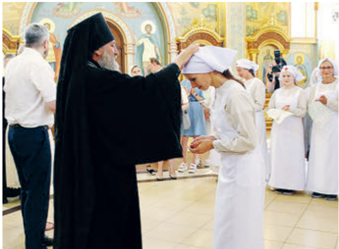
В качестве служебной одежды для калининградских сестер милосердия за образец взята униформа дореволюционного сестричества в России.

Похоронили Василия на кладбище бывшей церкви Троицы, как раз рядом с Покровским собором, который начали строить в 1555 году, в честь завершения казанских походов и взятия Иваном Грозным Казани. После канонизации блаженного в 1588 году уже царь Федор повелел построить над его могилой церковь. Позже она была присоединена к основному храму, став приделом Василия Блаженного (а всего в Покровском соборе 11 приделов – церквей). В зимние холода весь храм не топили – только церковь Василия Блаженного. И в народе, собираясь в Покровский собор на молитву, говорили: «пойдем к Василию Блаженному». Так постепенно и закрепилось за собором название – храм Василия Блаженного.