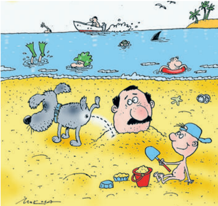
ИЛЛЮСТРАЦИЯ НИКОЛАЯ ВОРОНЦОВА/CARTOONBANK.RU

Наши черноморские здравницы начали принимать отдыхающих с середины июня, полтора месяца у Крыма и Сочи не было зарубежных конкурентов. В разгар лета аэропорт Адлера принимал по 40 тысяч пассажиров в сутки, на вокзал приходили по 18–20 пассажирских составов из разных концов страны. Еще больше оказалось желающих отдохнуть в Крыму, куда теперь легко добраться на поезде или на авто. Но тут вдруг выясняется, что для полноценного отдыха мало теплого моря и лежака на пляже.