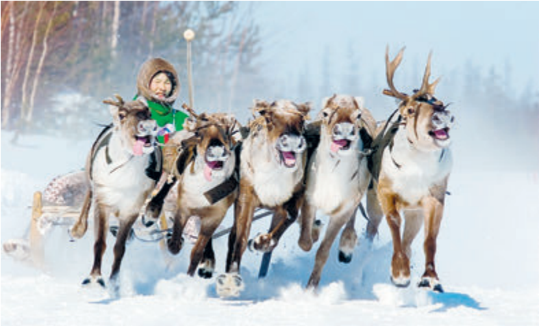
Гонки на оленьих упряжках.

Многие малочисленные народы проживают на труднодоступных территориях и ведут кочевой образ жизни. Их представителям предприятия «Роснефти» помогают приобрести необходимое оборудование и технику для обес-