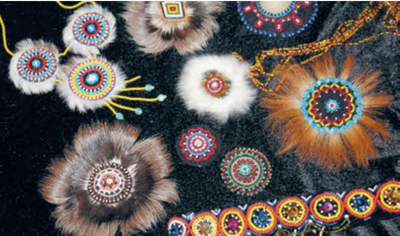
Изделия народных промыслов.

эвенкийского языка» совместно с лингвистами Сибирского федерального университета. В рамках реализации этого проекта ведется разработка первого сайта об эвенкийском языке, сбор и консолидация эвенкийского фольклора.