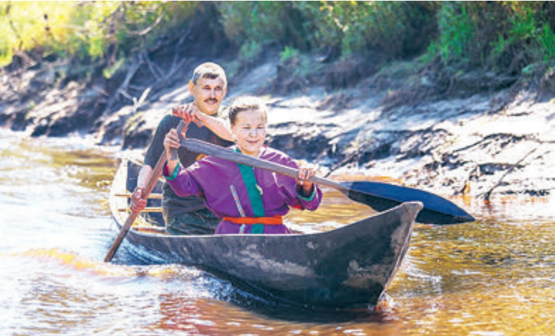
Сплав по быстрой реке.

«Роснефть» реализует проекты по сохранению и развитию традиционной культуры коренных народов. Так, в Красноярском крае ВСНК поддерживает проект «Школа начинающего каяера» на базе интерната при средней образовательной школе села Байжит по обучению детей управлению собачьей упряжкой и «Возрождение