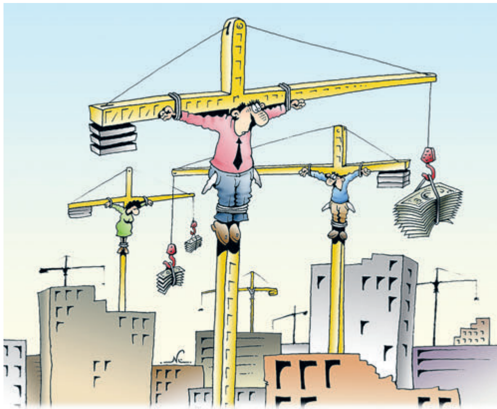
ИЛЛЮСТРАЦИЯ ИГОРЬ КИЙКО / CARTOONBANK.RU

• В ФОКУСЕ • Их ряды никак не редют – несмотря на регулярные обещания властей всех рангов покончить с этим злом. В Пензе пикетами под окнами местного правительства стоят несостоявшиеся жильцы ЖК «Тернопольский». В Красноярске протестуют почти 2 тысячи семей. В Московской области список недавно пополнили жители Балашихи, а всего в Подмосковье «без вины бездомных» десятки тысяч. Жилищное жульничество процветает в Бурятии, Хабаровске и Приморье. Достроить в 2020 году 22 долгостроя на 4416 уже оплаченных квартир требуют петербуржцы... АЛЕКСАНДР КИДЕНИС