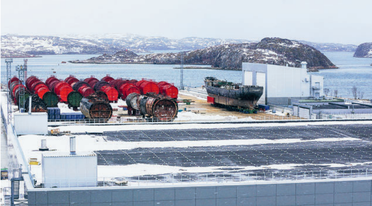
Хранилище отработанных реакторных отсеков в губе Сайда. Баренцево море.

Ну и, наконец, в северных морях покоятся затонувшие суда, в том