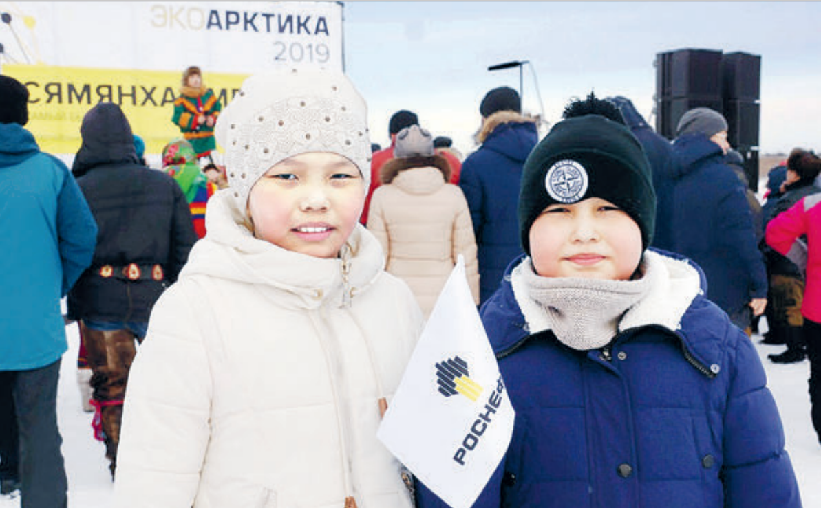
Жители Севера с юных лет учатся беречь природу.