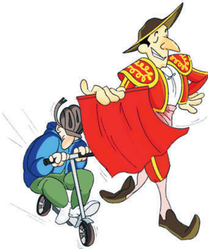
ИЛЛЮСТРАЦИЯ НАСТАСЬИ НОВАКОВСКОЙ

А вот еще: 15-летний самокатчик на улупу улицы Типанова и про-