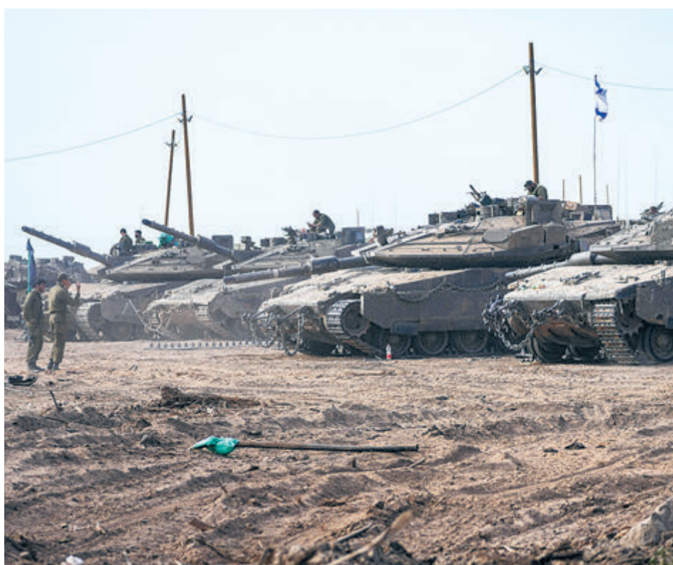
Израильские танки в Газе остановились. Надолго?

На территории Газы после отъезда основной части войск Израиля останется лишь 933-я пехотная бригада «Нахаль» и 162-я дивизия на севере. В круг обязанностей первой входит защита «коридора Нецарим» от границы Газы с Израилем до побережья Средиземного моря. Согласно новой тактике, самыми эффективными признаны точечные рейды после получения разведанных, а ЦАХАЛ будет возвращаться в Хан-Юнис только «по мере необходимости». Как заявлено, похожие операции продолжатся в других районах, в том числе в Рафахе.