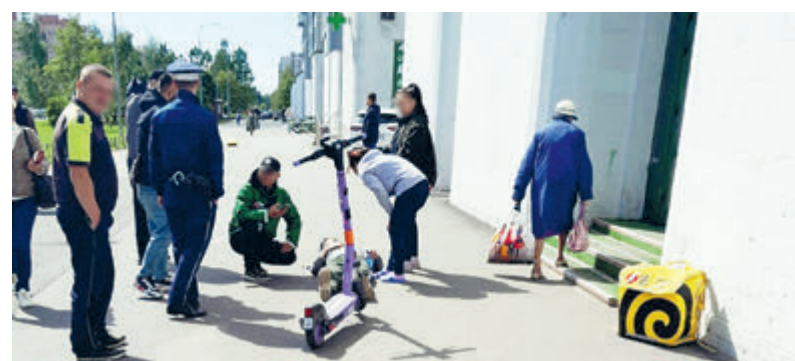
Очередное ЧП на улицах Санкт-Петербурга.