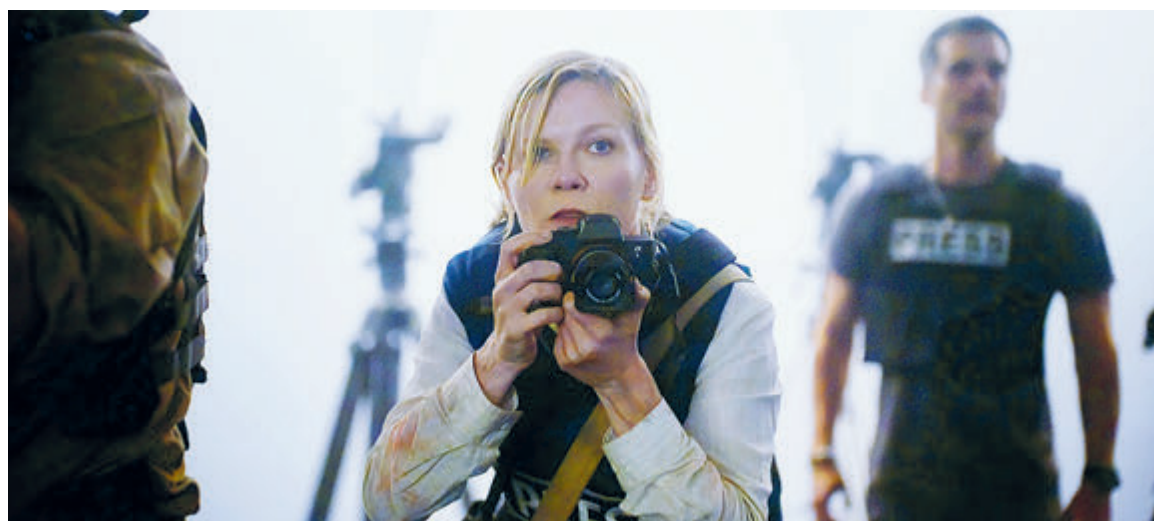
Братоубийственная бойня – это всегда зло, в какие бы одежды оно ни рядилось.

Вот вроде бы обычная автозаправка. Но канистра бензина здесь может оказаться дороже человеческой жизни. На задвор-