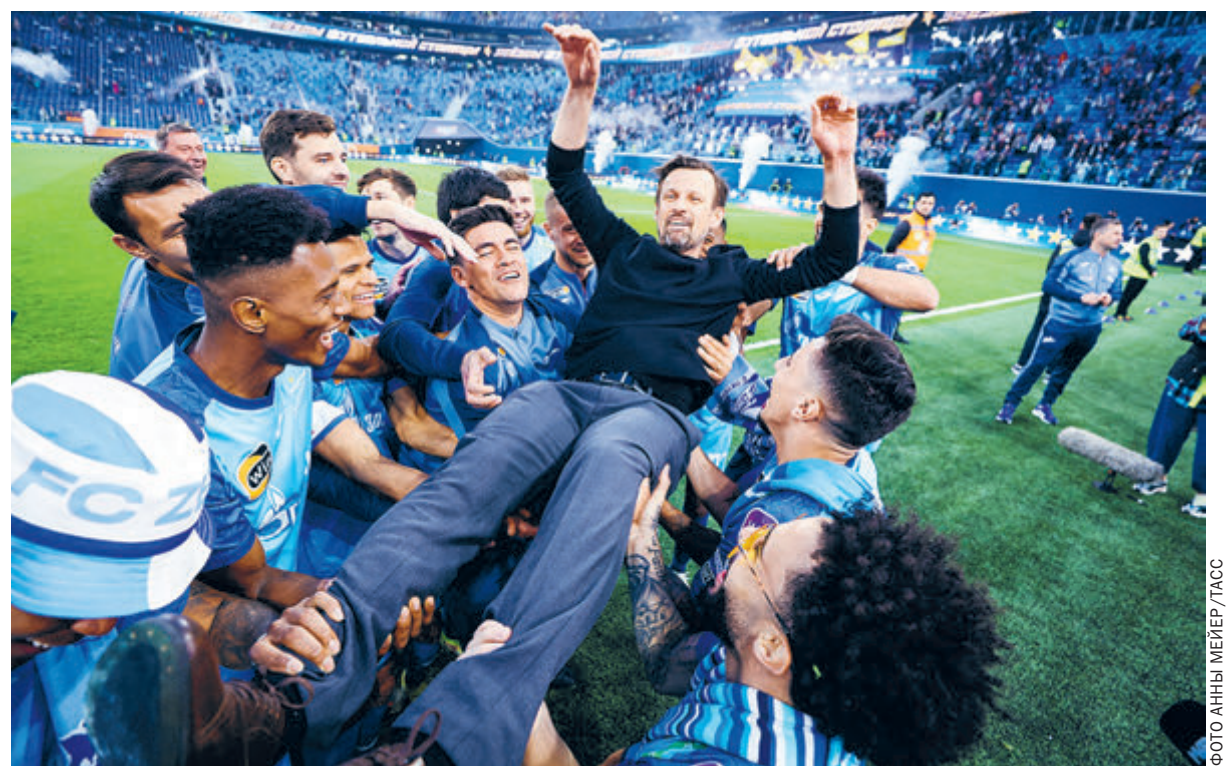
Сергей Семак со своим «интернационалом».

– Именно сегодня, в период отстранения от еврокубков, надо бы к группе квалифицированных иностранцев приблизить уровень российских воспитанников. Но от детско-юношеского сектора нашего футбола отдача очень низкая. «Зенит» и «Краснодар» – одни из немногих наших клубов, где скаутская работа ведется хорошо. К кандидатам-легионерам пристраиваются, следят за их ростом, а после приобретения им в Петербурге и Краснодаре создают хорошие условия. Но во