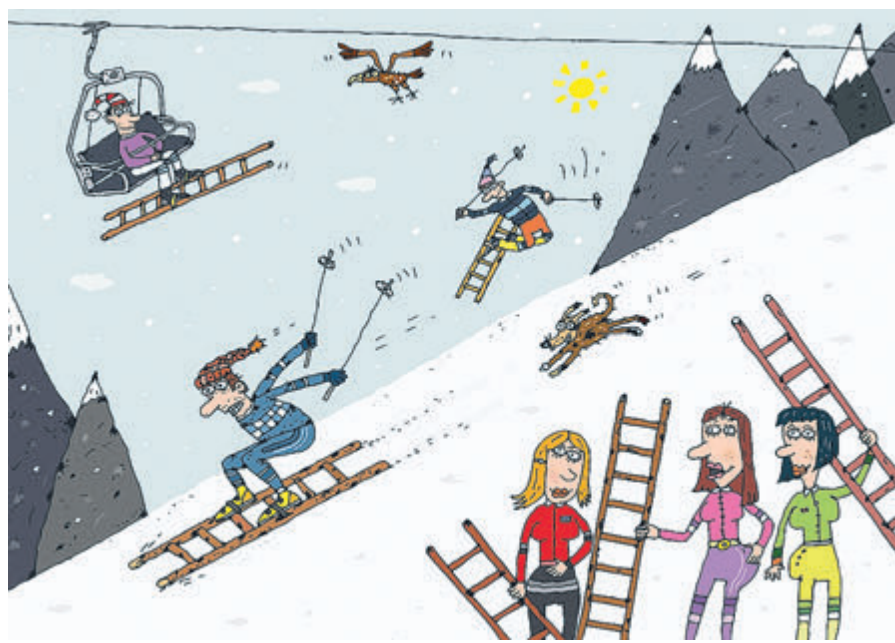
ИЛЛЮСТРАЦИЯ СЕРГЕЯ БЕЛЕНКОВА, CARTOONBANK.RU

Оправдан ли такой пофигизм тех, кто, несмотря на все увещания, уже пакует чемоданы? На мой взгляд, это тот случай, когда риск перевешивает удовольствие. Вторая волна пандемии в Северной столице оказалась сильнее первой, коечный фонд в клиниках трещит по швам, врачи не справляются с перегрузками. По оценкам Роспотребнадзора, хуже ситуация с распространением коронавируса только в Калининградской области, которая то-