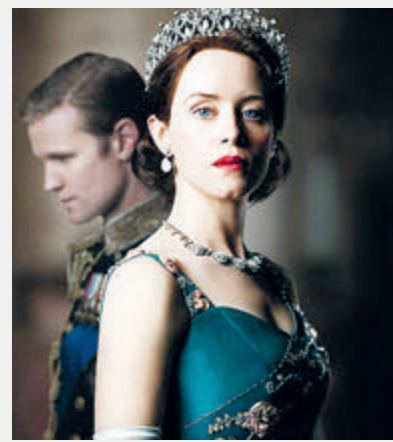
В Сети появился трейлер четвертого сезона американского сериала «Корона», рассказывающего историю британской королевской семьи. Как следует из содержания ролика, среди действующих лиц появятся две наиболее знакомые нашему обывателю фигуры. Это принцесса Диана, чья трагическая гибель в свое время обжурчалась на нашем ТВ столь же часто и подробно, как сейчас внебрачные дети малоизвестных российских актеров и певцов. И премьер-министр Великобритании Маргарет Тэтчер. Роль «железной леди» сыграла Джиллиан Андерсон. А несчастную супругу принца Чарльза – актриса Эмма Норрин. Будут на экране и маленькие отпрыски четы – Уильям и Гарри. Впрочем, и в третьем сезоне «Короны», вышедшем год назад, появлялись знакомые лица. Действие там разворачивалось в 1960-х годах, а разве можно в рассказе о них обойтись без The Beatles, которых Ее Величество удостоила приема?! Кстати сказать, главную героиню Елизавету II играют разные актрисы. И это правильно. Все-таки Бог дал королеве очень длинную жизнь.

В Сети появился трейлер четвертого сезона американского сериала «Корона», рассказывающего историю британской королевской семьи. Как следует из содержания ролика, среди действующих лиц появятся две наиболее знакомые нашему обывателю фигуры. Это принцесса Диана, чья трагическая гибель в свое время обжурчалась на нашем ТВ столь же часто и подробно, как сейчас внебрачные дети малоизвестных российских актеров и певцов.