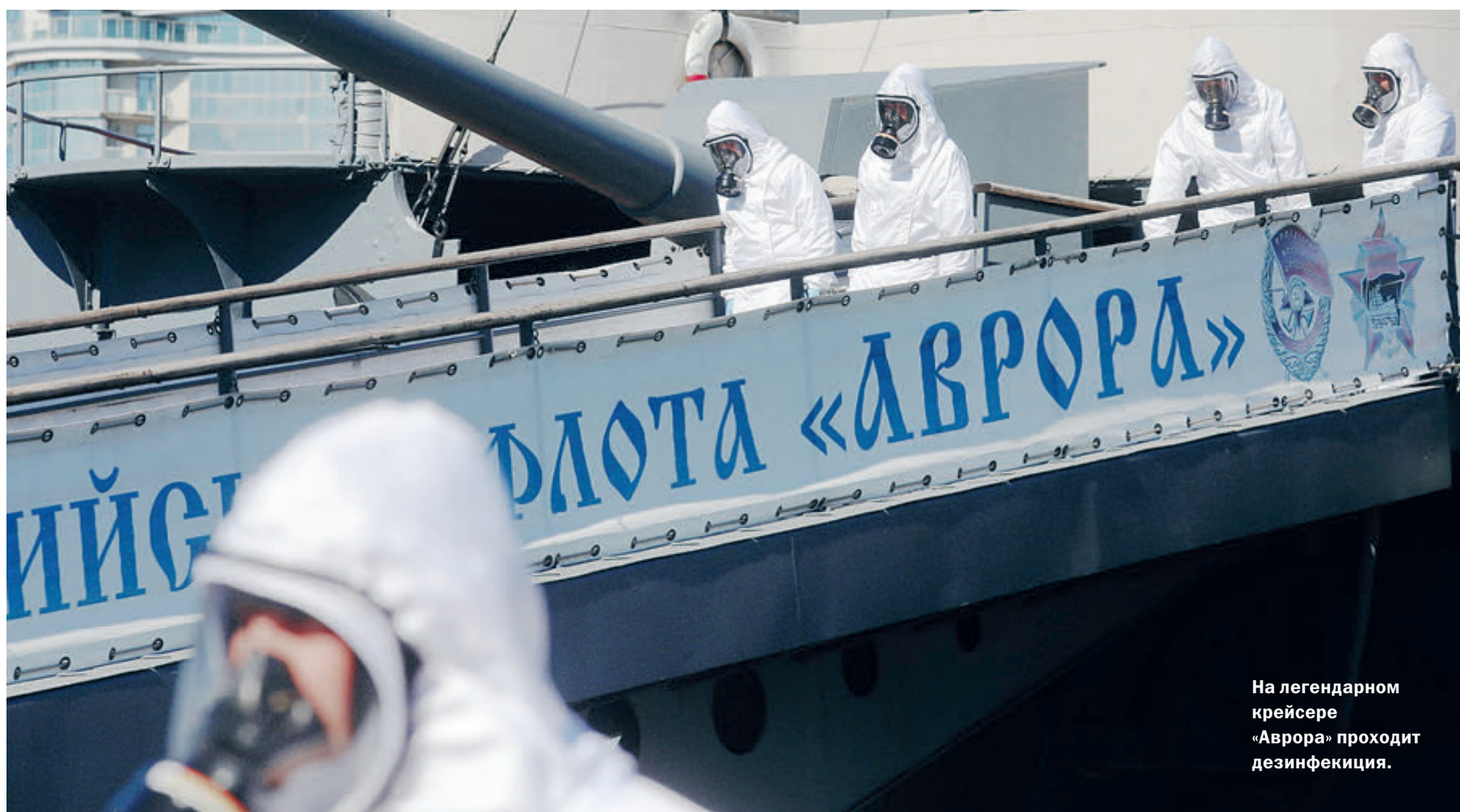
На легендарном крейсере «Аврора» проходит дезинфекция.

На планете за первое полугодие на 8,8% уменьшились выбросы парниковых газов. Это рекордное сокращение в истории, сообщил журнал Nature Communications