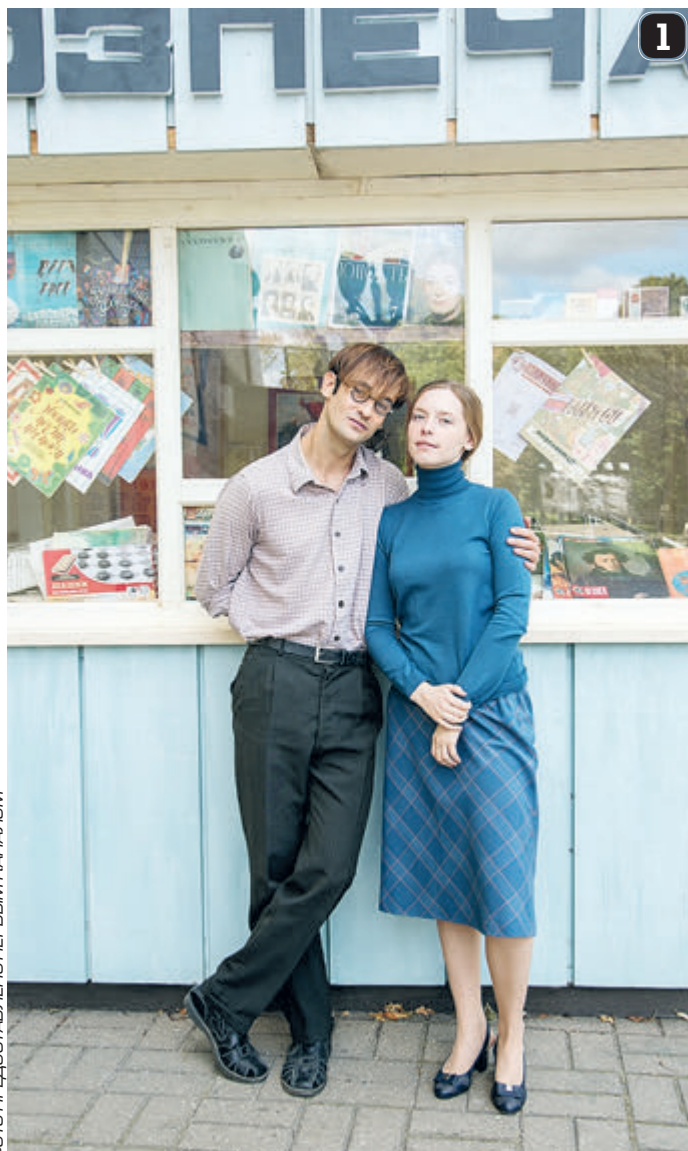
ФОТО ПРЕДСТАВЛЕНИЕ ПЕРВЫМ НАЧАЛОМ