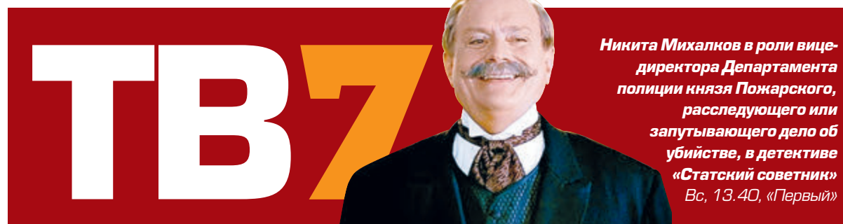
Никита Михалков в роли вице-директора Департамента полиции князя Пожарского, расследующего или запутывающего дело об убийстве, в детективе «Статский советник» Вс, 13.40, «Первый»