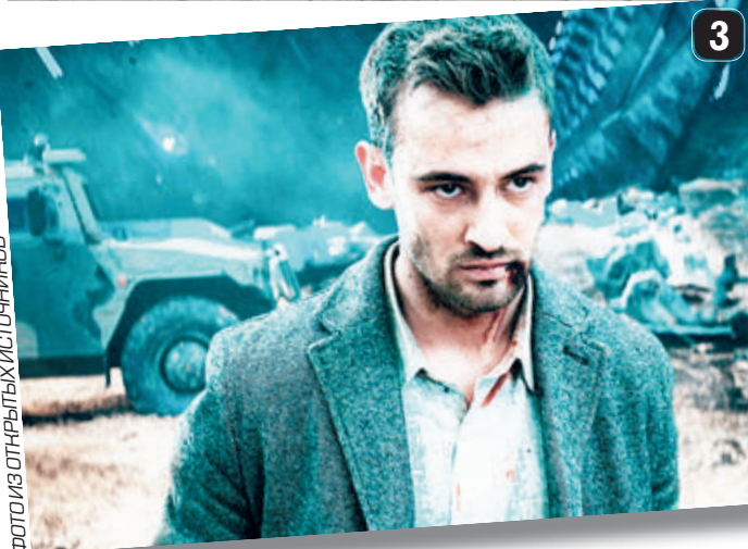
ФОТО С ОПЫТНОГО КУРСА ИСТОРИКОВ