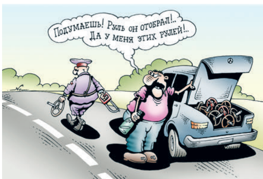
ИЛЛЮСТРАЦИЯ ИГОРА НИКОИНО/САНКТ-ПЕТЕРБУРГ

Ежемесячно выявляются сотни случаев управления арендованными автомобилями под чужими учетными записями. Растущая популярность каршеринга привела к формированию рынка фейковых аккаунтов, которые можно по сходной цене купить за пару минут. Услуга пользуется особым спросом у несовершеннолетних лихачей, а также у водителей, попавших в черные списки прокатных компаний или лишенных права управления авто. Не останавливает даже перспектива уголовной ответственности (использование чужого аккаунта для минутной аренды автомобиля подпадает под действие статьи 166 УК РФ «Неправо-