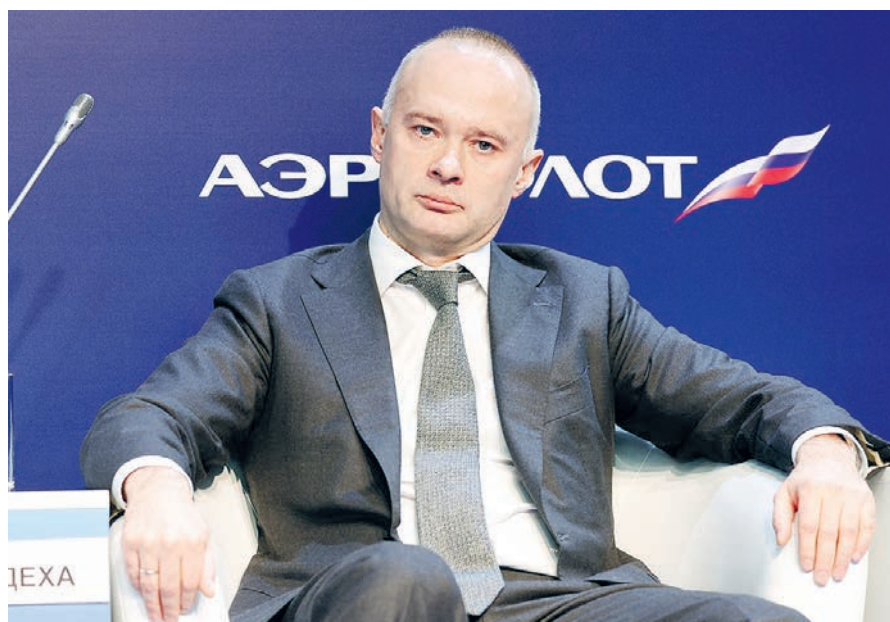
Генеральному директору Объединенной авиастроительной корпорации Вадиму Бадехе по должности положено строить высокие планы.

Однако остановить этот поток оптимистических предположений невозможно. Вот и нынешний глава Объединенной авиационной корпорации (ОАК) Вадим Бадеха в преддверии Петербургского международного экономического форума включился в гонку громких обещаний: «Россия – великая авиационная держава. Поэтому наши самолеты могут занимать и 50, и 70, и даже 100% отечественного парка. Если совпадут патриотизм, здравый смысл и экономическая эффективность». Ключевое слово тут «могут». Но тогда получается: могут,