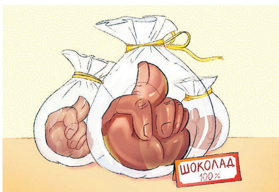
ИЛЛЮСТРАЦИЯ НАСТАСЬИ НОВАКОВИЧНОЙ

При этом покупатели за минувший год меньше ели натурального шоколада, зато в лидеры сладких продаж вышли зефир и мармелад. Те, кто выбирает качественный продукт, продолжают его покупать, но го-