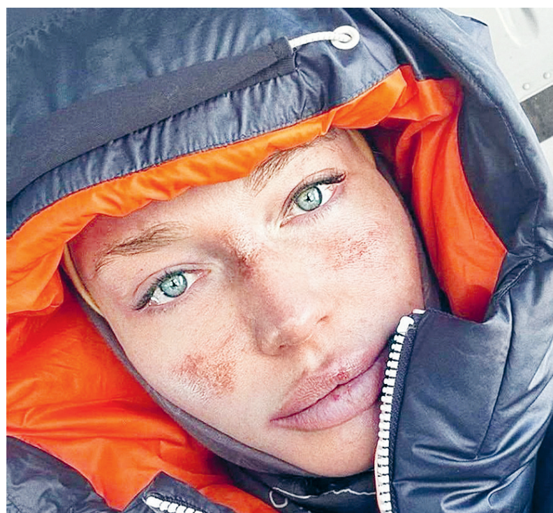
ФОТОГРАФИИ ИЗ ОТКРЫТЫХ ИСТОЧНИКОВ