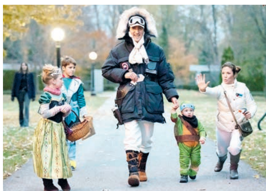
Премьер-министра Канады на прогулку может встретить каждый.

Во время пути в сумерки стараемся вести оживленную беседу, помогаем водителю отогнать дремоту. Впрочем, на тот случай, если его сморит сон и машину поведет к встречной полосе, по обоим краям нанесена сплошная рифленая «линейка»: она сразу даст знать о себе хорошей встряской автомобиля. До мелочей продумана безопасность водителя и пассажира. Бросаются в глаза предупредительные знаки о возможной встрече с лосями и оленями.