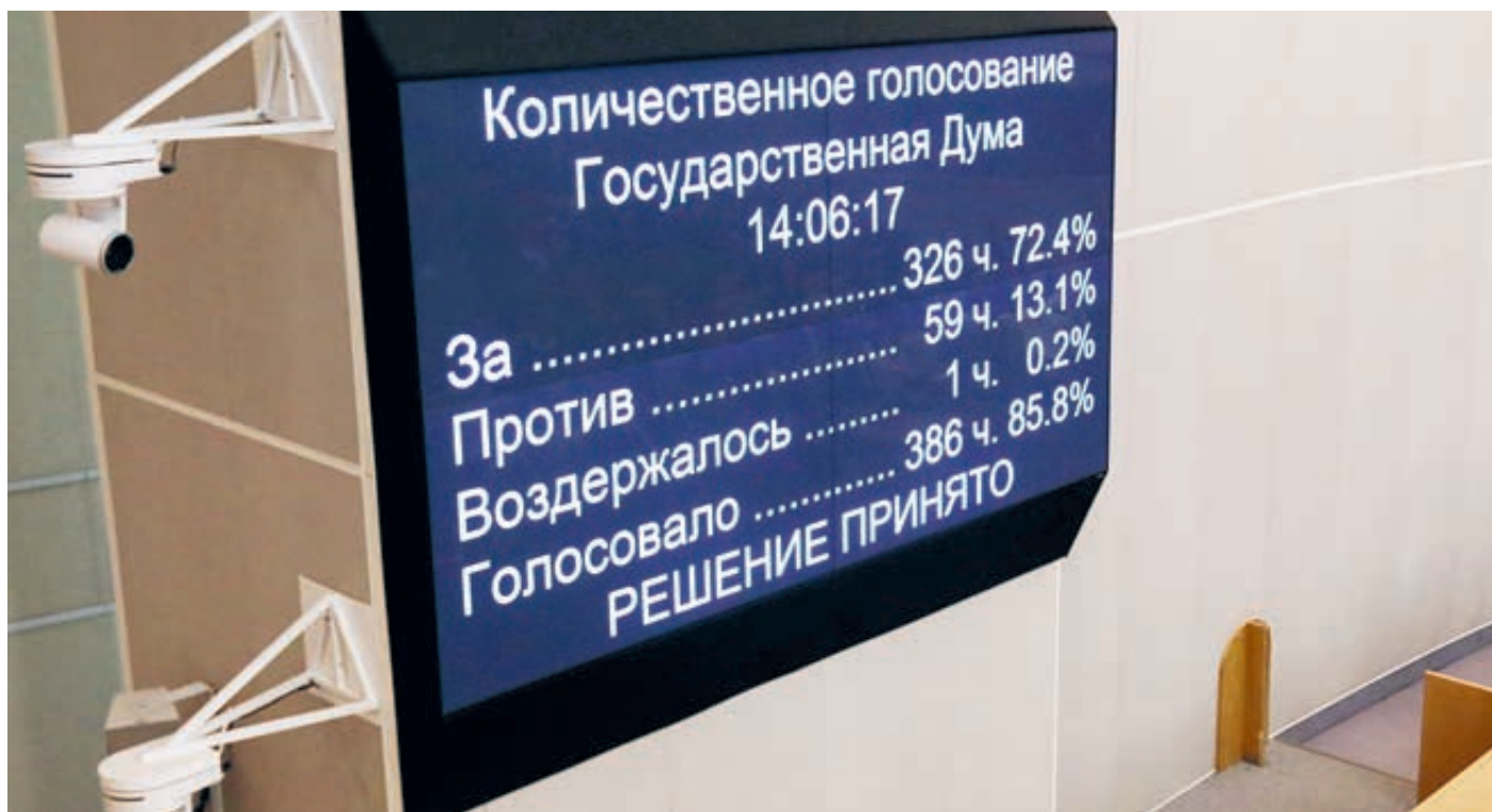
Среда. Голосование в Госдуме.

С 2006-го такая сверхсмертность начала уменьшаться. Однако до перелома далеко. Вот данные за прошлый год. Среди 20–39-летних мужчин почти 80 тысяч человек умерли молодыми. В возрастной группе 40–49 завершили жизненный путь свыше 80 тысяч россиян. В следующей группе (от 50 до 59 лет) годовые потери составили уже свыше 150 тысяч. В общей сложности раньше 60 лет попрощались с жизнью в минувшем году бо-