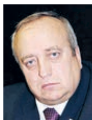
Франц Клишчевич член Совета Федерации

— В прошлом году произошел положительный разворот в российской экономике. Мы начали набирать темпы роста.