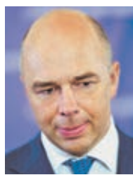
Антон Силуанов министр финансов РФ

— Значительная часть налоговых льгот не работает, не является эффективной. И может быть принято решение о ликвидации этих неэффективных льгот.