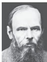
Федор Достоевский писатель (из письма С.Д. Яновскому, 28 сентября (10 октября) 1867 года, Женева)

— Насчет «дворцов» Пенсионного фонда... Все они построены по нормативам. Просто нужно зайти внутрь — это обычные офисы.