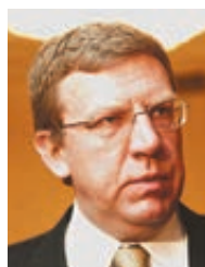
Алексей Кудрин глава Счетной палаты

— Может, как раз «Протоны» падали из-за того, что мы вовремя не подхватили тренд на перевооружение.