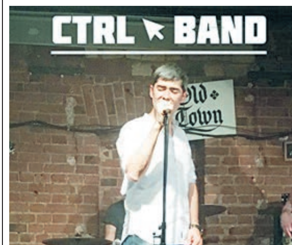
Экс-замминистра транспорта РФ Алан Лушников.

Ну а теперь двинемся дальше в закулисье. Как стало известно, выборный штаб отказавшегося от дальнейшей борьбы за губернаторское кресло Андрея Тарасенко