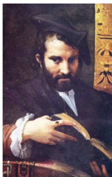
«Портрет мужчины с книгой» Франческо Пармиджанино.