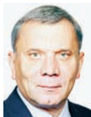
Юрий Борисов вице-премьер правительства РФ

— Значительная часть налоговых льгот не работает, не является эффективной. И может быть принято решение о ликвидации этих неэффективных льгот.