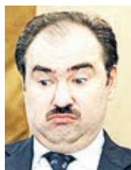
Антон Дроздов глава ПФР

— Типичная конспирология. С таким же успехом можно было назвать Руслана Боширова майором Прониным, если кто помнит персонажа из анекдотов времен СССР. Чтобы сюжет не потерял остроты, он будет обрастать все новыми подробностями.