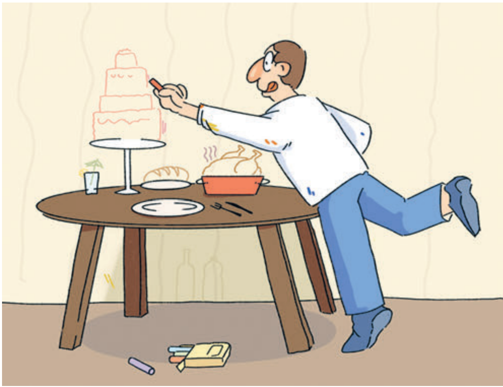
ИЛЛЮСТРАЦИЯ НАСТАСИЯ КОВАЛЕВСКАЯ

На днях президент Владимир Путин заявил, что Россия вошла в мировой топ экспортеров продуктов питания. А ведущими импортерами российской сельскохозяйственной продукции в минувшем году стали Китай (7,6 млрд долларов) и Турция (5 млрд), следом идут Казахстан (3,3 млрд), Белоруссия (2,8 млрд) и Египет (2,5 млрд долларов). Наибольшую долю в стоимостном объеме экспорта российских продуктов по итогам 2023 года занял экспорт зерновых (37,4%), далее следуют масложировая (19,5%) и прочая продукция АПК (15%), рыба и морепродукты (12,5%), продукция пищевой и перерабатывающей промышленности (11,5%), мясная и молочная продукция (4,2%). Это, конечно, замечательно, что наша страна кроме нефти и газа может поставлять за рубеж и другую жизненно важную продукцию. И бюджет пополняется за счет налоговых и таможенных платежей. Но как это отражается на кошелках граждан и на разнообразии и доступности продуктов питания россиян?