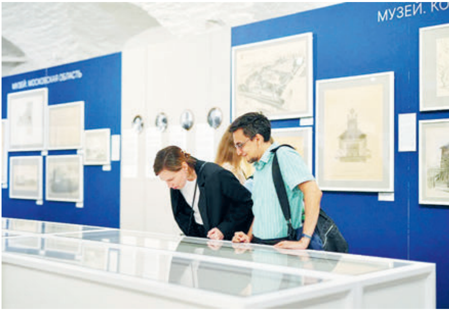
ФОТО ИСТОРИЧЕСКОГО ЦЕНТРА

Этот масштабный научный проект незаменим в деятельности как современных зодчих, так и госструктур по охране наследия. В его анналах постройки всех эпох в истории России, расположенные