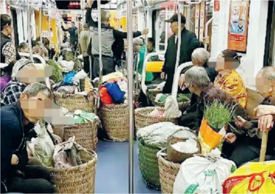
Китайские крестьяне в метро везут на продажу дары земли.

Эту продукцию с удовольствием покупают и местные рестораны, коих