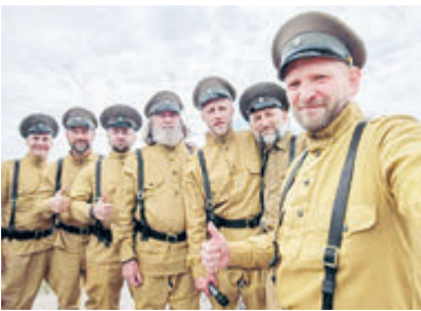
КРОНШТАДТ — 660 КМ ОТ МОСКВЫ

По словам организаторов, это не последняя экспедиция по следам Арсеньева. Планируется как минимум еще одна — от Кавалерова на север,