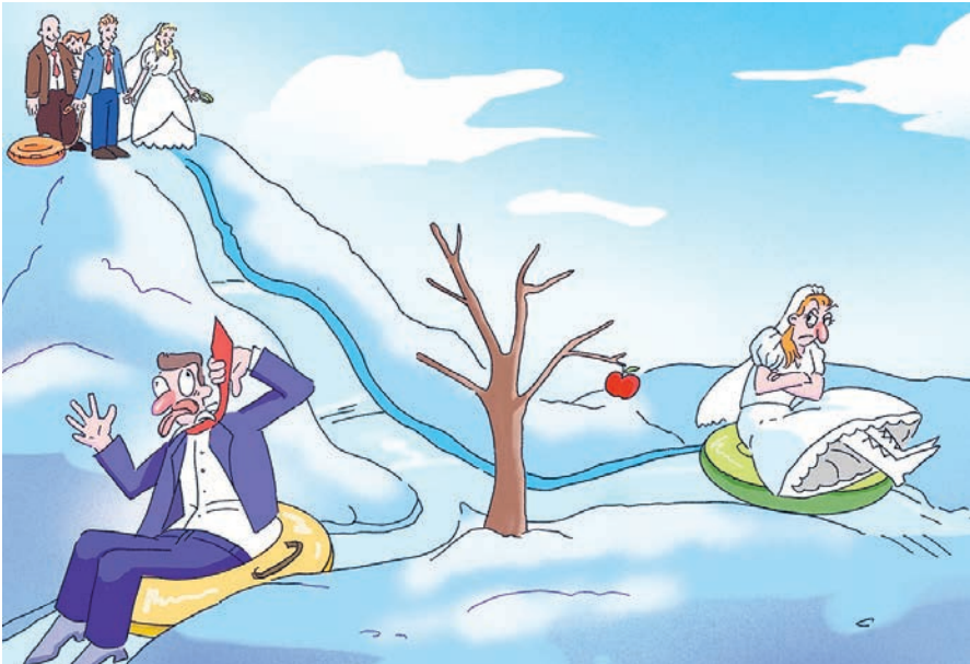
ИЛЛЮСТРАЦИЯ НАСТАСИИ КОБАКОВОЙ

У психологов, конечно, тут как тут: готовы научное объяснение такому социальному явлению: длинные праздники являются мощным катализатором, провоцирующим стремительное развитие кризисов в отношениях. «Сами по себе выходные не создают проблем, они лишь поднимают на поверхность все, от чего люди старательно отмахивались на протяжении месяцев и прятались за рутинной. Когда же эта рутинная отступает в тень, граждане остаются наедине с ворохом нерешенных вопросов, которые больше некуда откладывать», – рассказыва-