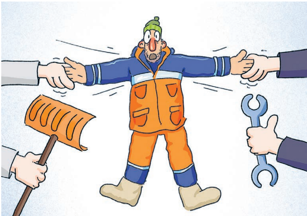
ИЛЛЮСТРАЦИЯ НАСТАСЬИ КОВАЛЕВОЙ

По сообщению Росстата, среднемесячная зарплата по стране составляла 74 854 рубля, а в Москве была почти вдвое выше – 160 700 рублей, на 13,1% больше января-2024. Столичные власти ожидают, что в наступившем году она увеличится на 14% и составит не менее 196 тысяч. Но рост, говорят, будет точечным, в первую очередь он затронет высококвалифицированных специалистов в дефицитных сферах. Но ведь даже столичная