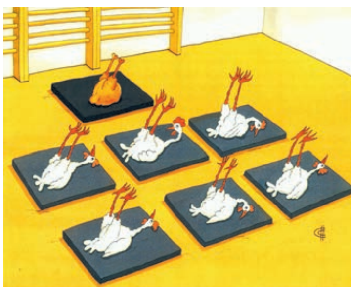
ИЛЛЮСТРАЦИЯ СЕРГЕЯ БИЧЕНКО / CARTOONBANK.RU

П ервыми, кто может требовать прибавку к зарплате, являются PR-специалисты, SMM- и контент-менеджеры. Почему? Выживший бизнес будет стремиться наверстать упущенное: улучшить сервисы и привлекать платежеспособных клиентов. По той же причине продолжится рост доходов и у IT-специалистов, маркетологов и аналитиков, чьи услуги были востребованы и до кризиса.