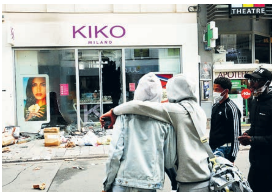
Брюссель, июнь-2020. Здесь прошли манифестанты.

Свобода предпринимательства, правила ВТО... И куда все это делось? Запад почему-то обо всем забыл, когда дело касается его экономики