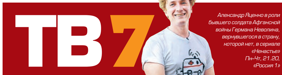
Александр Яценко в роли бывшего солдата Афганской войны Германа Неволина, вернувшегося в страну, которой нет, в сериале «Ненастье» Пн-Чт, 21.20, «Россия 1»