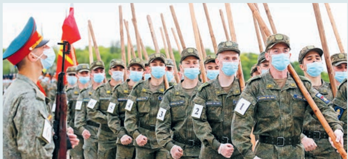
Репетиция парада Победы, который состоится 24 июня.