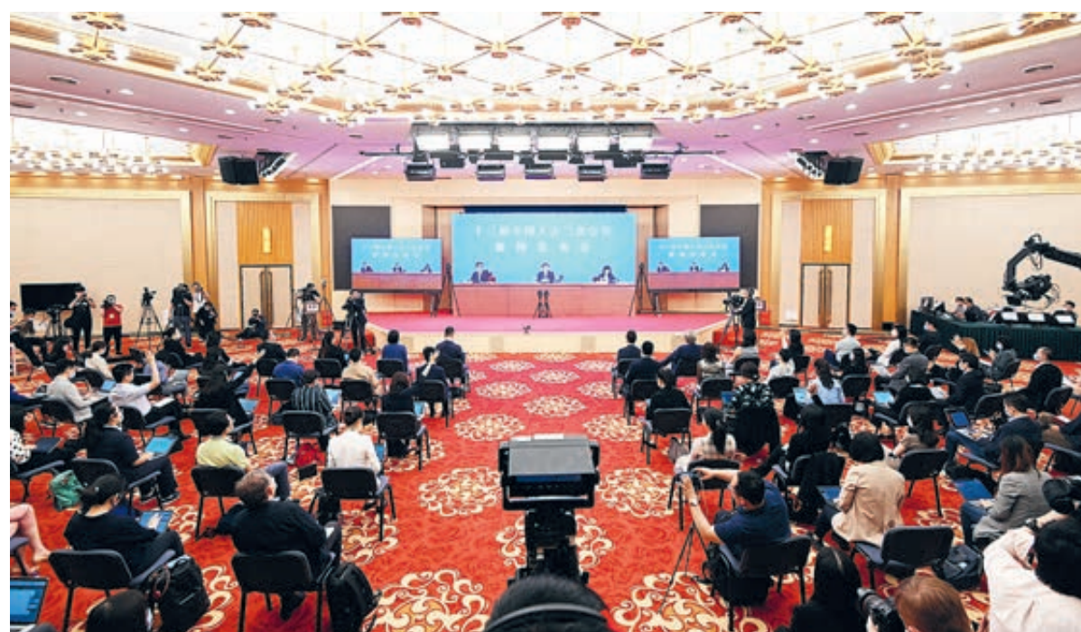
На пресс-конференции, посвященной ежегодной сессии ВСНП.

Сессии предоставят депутатам ВСНП и членам ВК НПКСК прекрасные возможности прийти к согласию, объединить знания и поднять моральный дух для достижения национальных целей. Эпидемия негативно сказалась на китайской экономике. По этой