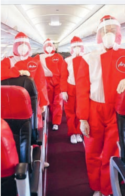
Крупнейший лоукостер AirAsia представил новую «антивирусную» униформу стюардесс: созданные известным дизайнером алые комбинезоны с логотипом компании напоминают противочумные костюмы

Кстати, в Японии все прилетающие обязательно тестируются на COVID-19 и остаются в аэропорту до получения результата. Аэропорт Токио открыл зону ожидания с кроватями из картона и одноразовыми матрасами (все бесплатно). Персонал в защитном снаряжении разносит закуски и воду.