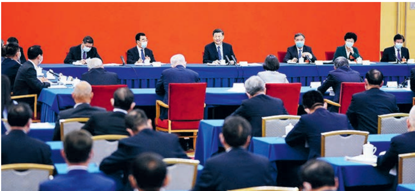
На заседании Всекитайского комитета Народного политического консультативного совета Китая 13-го созыва.

С момента образования Нового Китая впервые Всекитайское собрание народных представителей и Народный политический консультативный совет Китая