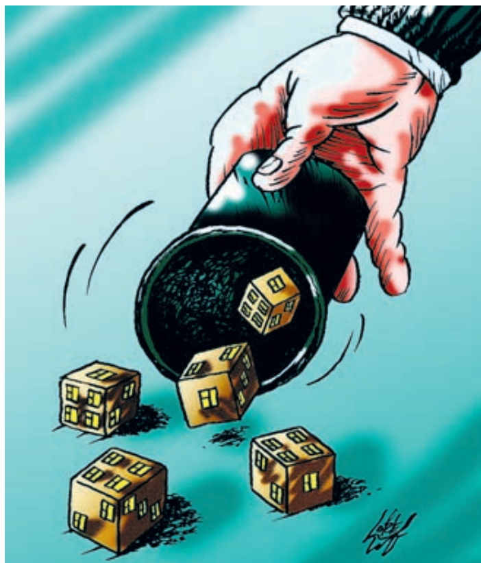
ИЛЛУСТРАЦИЯ: ОЛЕГ ЛОЖТКОВ/САТКОСОВАЯ. RU

С трашный сон раньше не завершится скоро, даже если эпидемия коронавируса пойдет на спад. К началу осени съемные квартиры и комнаты могут подешеветь еще на 15%, а к концу года и на треть. В процессе живого общения с потенциальными арендаторами собственники жилья уже сейчас готовы уступить 20–30% от объявленной ранее цены. Происходящее связано с объективными обстоятельствами: на рынке резко уменьшилось число платежеспособных клиентов