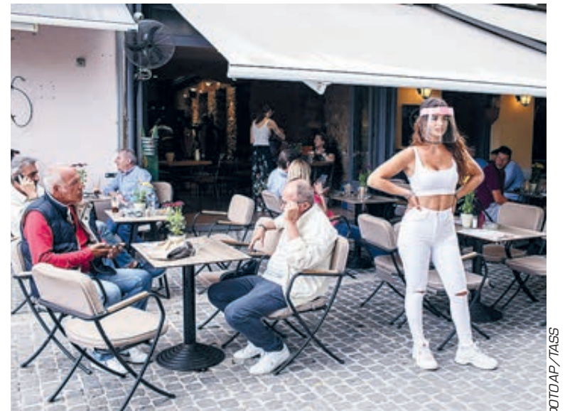
В Греции по-прежнему все есть: солнце, «Метакса» и девушки. Только нас там нет...

Визовые центры в Москве стран ЕС открываться не собираются, так что россиянам лучше рассчитывать на пляжи Крыма и Краснодарского края, берега Волги и Байкала, музеи Питера и Москвы. Но только после снижения числа заболевших до безопасного уровня. В любом случае этот турсезон в России, даже если он сместится на осень, может стать хорошей оказией для узнавания собственной страны и ее уникальных городов и дальних природных заповедников. Даже те страны, которые отменили или вот-вот отменят карантин (Грузия, Индия, Вьетнам, Таиланд, Египет, Турция), не жаждут сразу заполучить щедрых россиян, как, впрочем, и американцев, бразильцев и англичан – из-за опасений вспышки привезенного коронавируса, который сразу добьет любую туристическую отрасль.