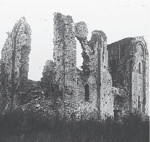
Церковь Спаса Преображения на Нередице до и после реставрации (1944 и 1958 годы). Наглядная иллюстрация того, сколько трудов понадобилось для восстановления святынь.

P.S. В Москву впервые привезли оригинальные фрагменты и копии этих фресок XII–XIV веков. Росписи Спаса на Нередице XII века демонстрируются в виде небольших композиций, собранных в 1944–1947 годах под руководством архитектора Любови Шуляк. Фрески Спаса на Ковалеве XIV века смонтированы на мощные основания по методике самого Грекова. Но какая же древнерусская выставка без икон? Ценный экспонат с историей – «Распятие» XV века из церкви Успения на Волотовом поле. В 2024 году икона снята с аукциона в Германии, куда была вывезена нацистами. Зритель, дошедший до финального зала выставки во флигеле «Руина», вознаградит зрелищем праздничного чина знаменитого храма.