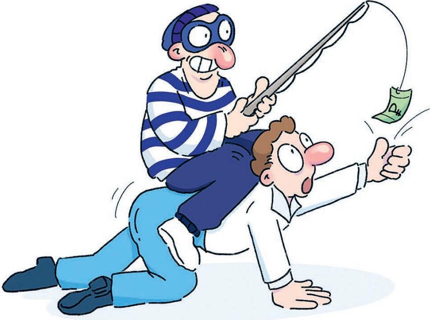
ИЛЛЮСТРАЦИЯ НАСТАСЬИ НОВАТЕНКО

ями о работе. Если жертва «клюет», мошенники получают доступ не только к информации о человеке, но и к ценным корпоративным данным. Сегодня многие вакансии с кисельными берегами и молочными реками размещаются не только в телеграм-каналах и соцсетях, но и на специализированных сайтах. Хотя это всего лишь ширма. После первого контакта общение переводится в мессенджеры... Все эти уловки связаны с хорошим знанием психологии. В самом деле, ищущие работу граждане — это, как правило, уязвимая часть населения. Ради успешного прохождения собеседования и выполнения тестового задания люди без разговоров скачивают и устанавливают все, что от них требуется. К тому же они зачастую находятся в состоянии стресса. Чтобы не попасть в просак, нельзя терять бдительности. Особенно если вам вдруг предлагают высокую зарплату, да еще без конкретных требований к претенденту. Настораживать должно и формальное проведение собеседования. Настоящий рекрутер выбирает лучшего кандидата на должность, поэтому обязательно поинтересуется опытом, документами, мотивацией, зарплатными и карьерными ожиданиями соискателя. Кроме того, сможет ответить на дополнительные вопросы. Что же касается влияния мошенников на рынок труда, то, по словам специалистов, количество атак на соискателей в будущем будет только расти, что может поставить под угрозу саму возможность удаленного поиска работы.