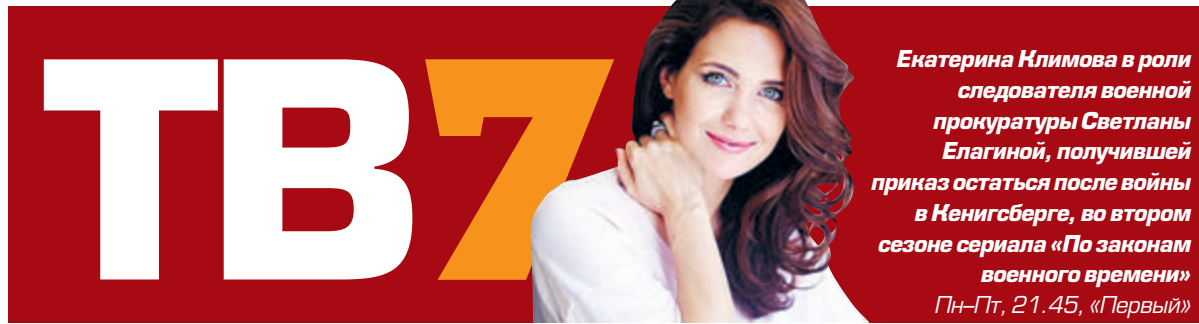
Екатерина Климова в роли следователя военной прокуратуры Светланы Елагинной, получившей приказ остаться после войны в Кенигсберге, во втором сезоне сериала «По законам военного времени» Пн-Пт, 21.45, «Первый»