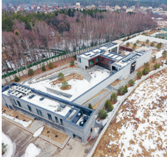
Перedelкино. Дом писателя Чубайса.